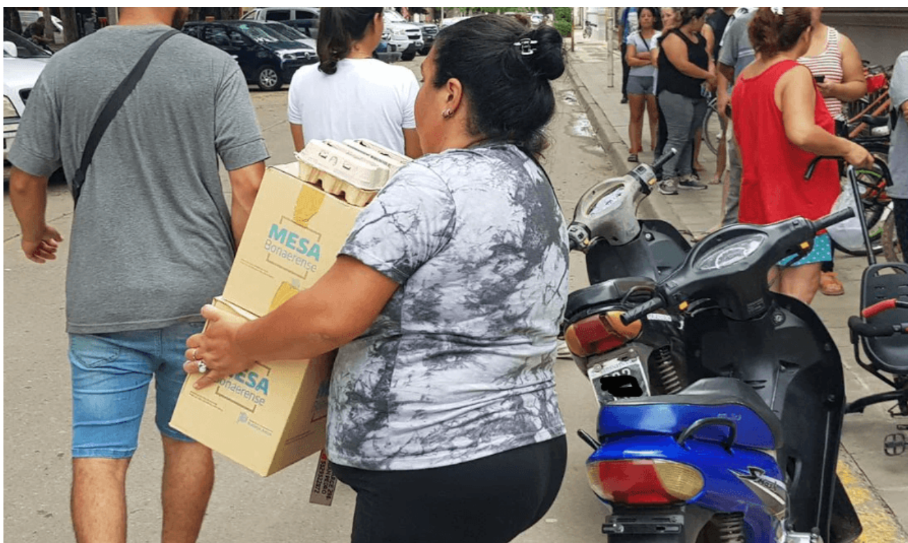
Entrega de cajas del Programa MESA.

abarcando desde el Nivel Inicial , que comprende a los niños desde los 45 días hasta los 5 años de edad inclusive; Nivel Primario y Nivel Secundario . Se lleva adelante de forma descentralizada a través de un ente executor que puede ser el Consejo Escolar o municipio , dependiendo el caso; y se complementa con el programa SAE (Servicio Alimentario Escolar) , destinado a alumnos de las escuelas públicas que se inscriban para acceder al “comedor escolar” en el cual reciben un almuerzo diario.