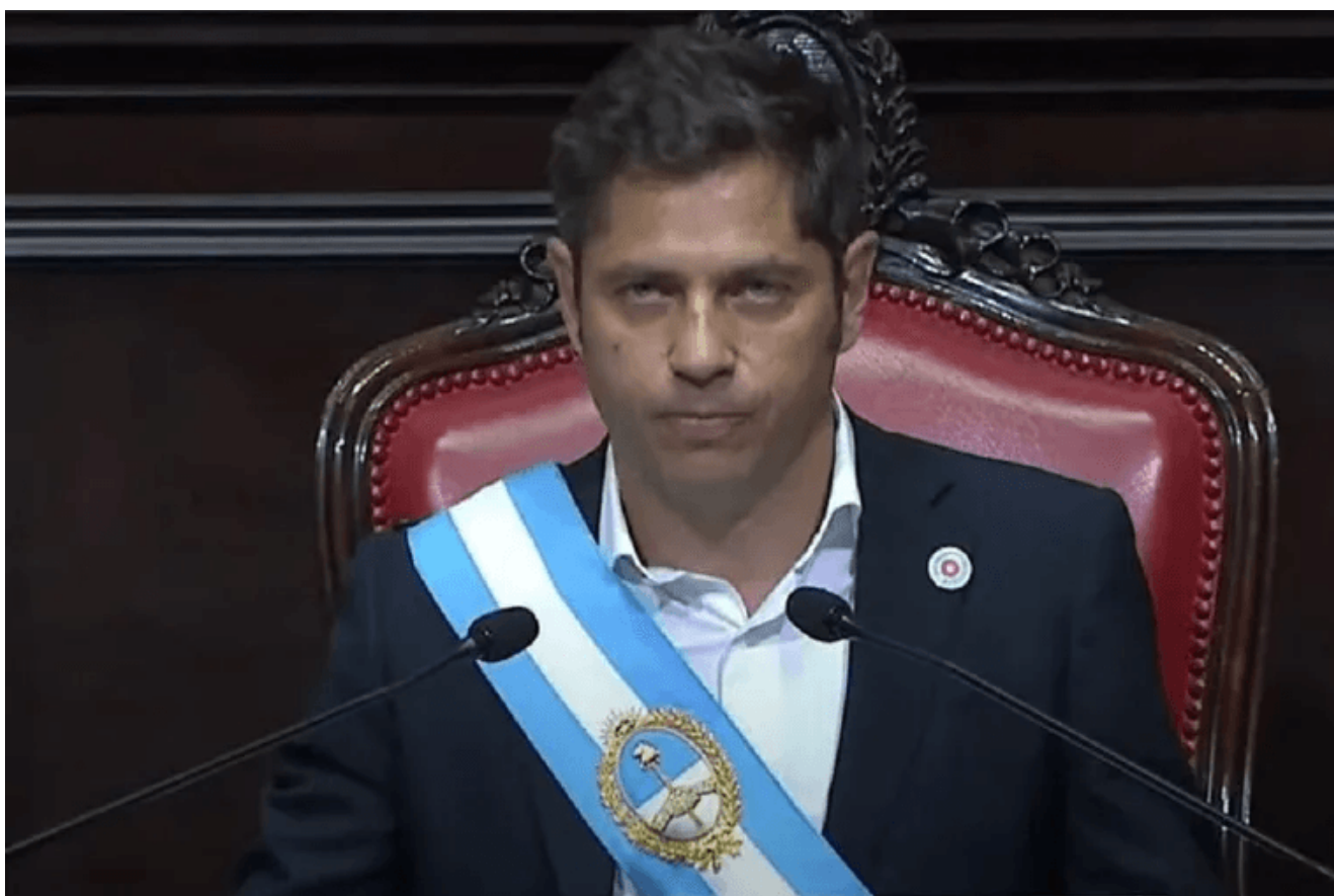
Axel Kicillof, gobernador de la provincia de Buenos Aires.

El mismo que se promociona en los cortes comerciales de C5N ; en los editoriales de El Destape ; en los canales de streaming y las redes sociales de la militancia, pero que en realidad es un Estado que, opta por financiar el blindaje mediático antes que asegurar la leche y el arroz para los niños de las escuelas públicas.