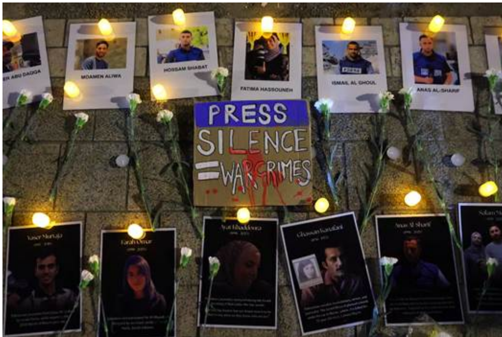
Ofrenda a periodistas asesinados en Gaza el 16/8/2025 en Malasia.

Reporteros Sin Fronteras sostiene que la “represión del régimen y la guerra que libran EE.UU. e Israel” tiene su réplica en otros territorios atacados. De hecho, “siguen situando a Irán (puesto 177; -1) en las últimas posiciones de la Clasificación”.