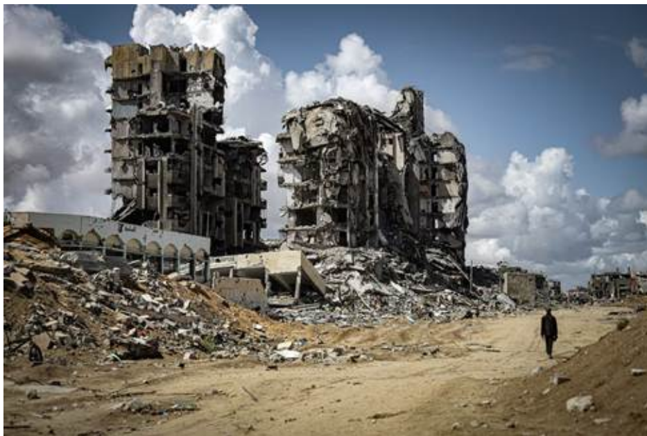
Fotografía tomada por Fátima Hassouna en 2024 en Gaza.

“Desde 2024, Palestina es el país más peligroso del mundo para los periodistas”, sentencia RSF, ya que desde octubre de 2023, cuenta “con más de 220 periodistas asesinados en Gaza a manos del Ejército israelí, de los cuales al menos 70 en el ejercicio de su labor”. Uno de los casos más emblemáticos fue el de Fátima Hassouna , reconocida fotoperiodista palestina, de menos de treinta años de edad. Fue asesinada en un ataque aéreo ocurrido el 16 de abril de 2025. Fue justo un día después de que se anunciara que el Festival Cannes iba a proyectar un documental sobre las charlas a distancia, vía WhatsApp, que mantuvo con la cineasta iraní-francesa Sepideh Farsi , llamado Put Your Soul on Your Hand and Walk (Pon tu alma en tu mano y sal caminando, 2025).