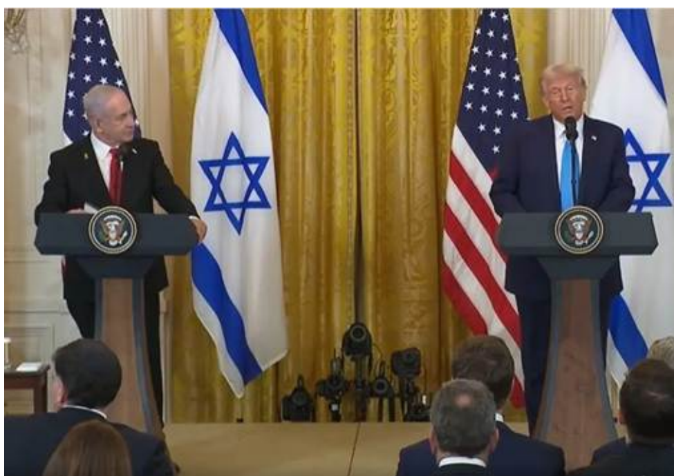
Trump y Netanyahu en la Casa Blanca, febrero de 2025.

Finalmente señala que “las medidas de represión contra los reporteros israelíes que cubren las protestas antigubernamentales también se han intensificado, mientras que un discurso cada vez más nacionalista presiona a los periodistas críticos para autocensurarse. Las campañas de difamación en Internet contra periodistas y medios son habituales” .