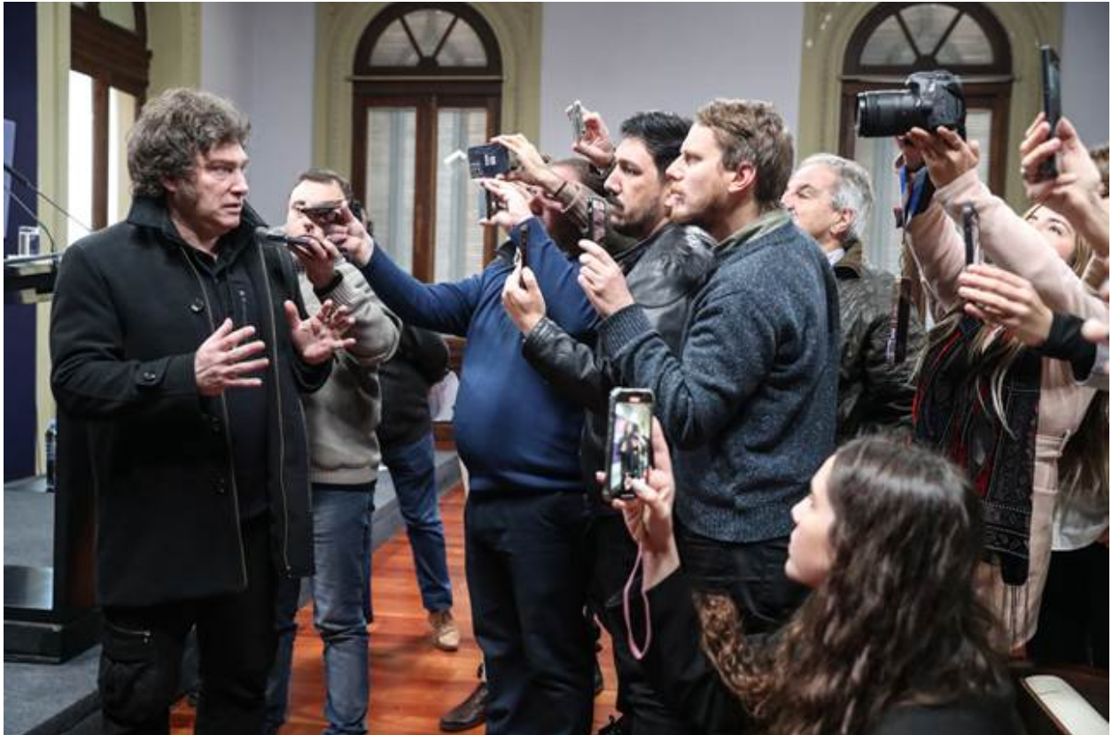
Milei en una de las conferencias de prensa de Adorni en 2024.