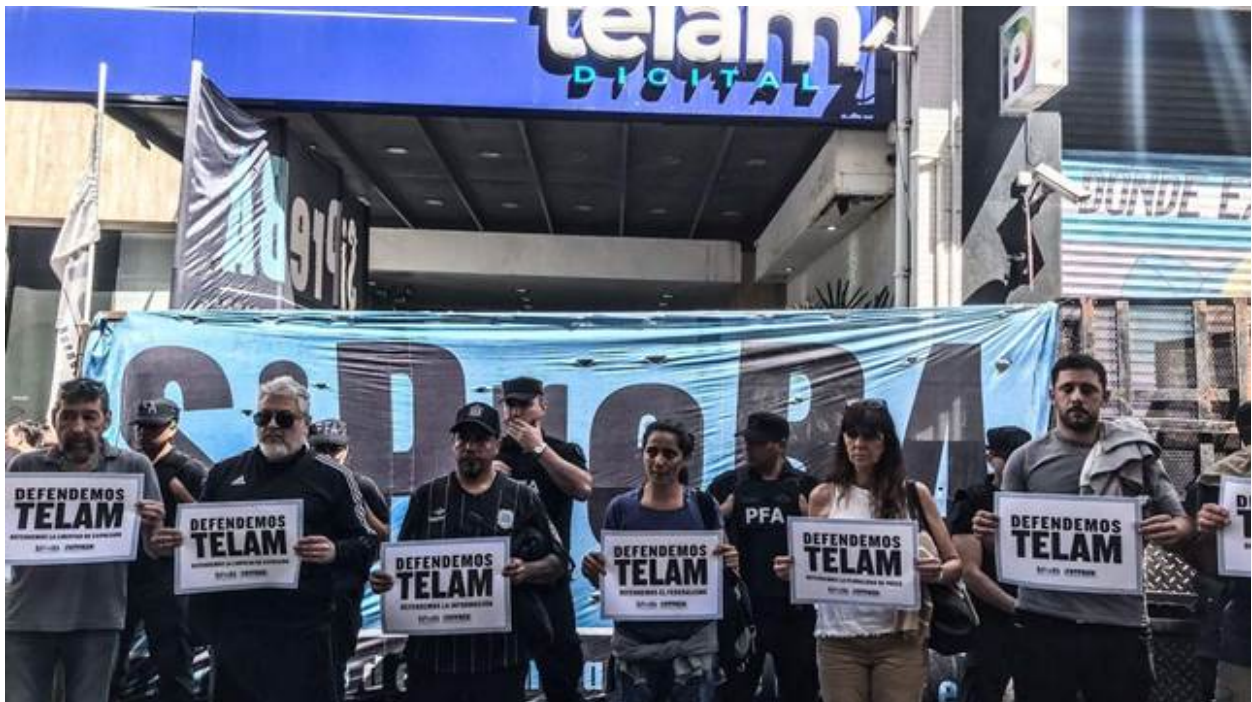
Foto de archivo de 2024 en una protesta contra el cierre de Télam.