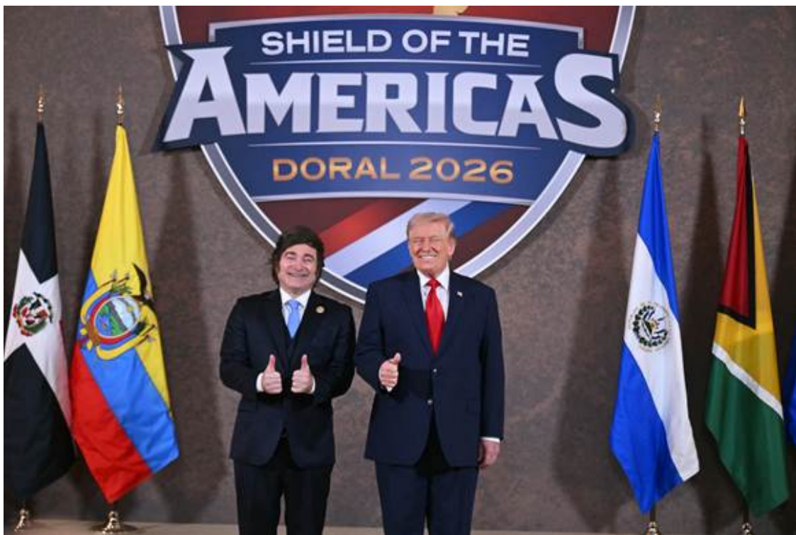
Trump y Milei en Miami.

Entre las explicaciones están los frecuentes ataques del presidente Donald Trump contra los periodistas de EE.UU. que se volvieron “una práctica sistemática, lo que ha relegado al país al puesto 64, siete menos que el año pasado”. Uno de los ejemplos de violaciones de los derechos de los periodistas fue la detención y deportación del periodista salvadoreño Mario Guevara , como así también los “drásticos recortes de plantilla de la Agencia estadounidense de Medios Globales (USAGM) ”.