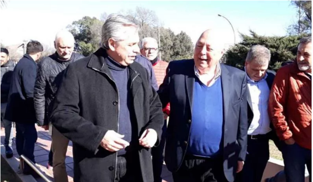
Foto de archivo de 2019 de Alberto Fernández, el candidato de Roberto Urquía.