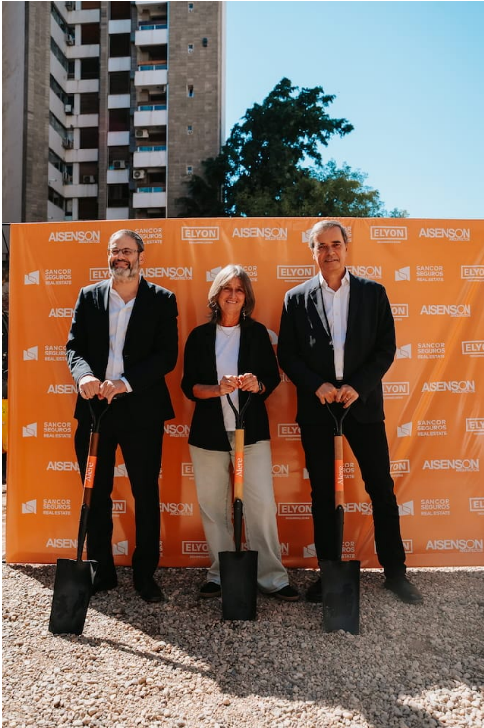
Personal de Elyon y Sancor Seguros, en un acto de marzo de 2026.