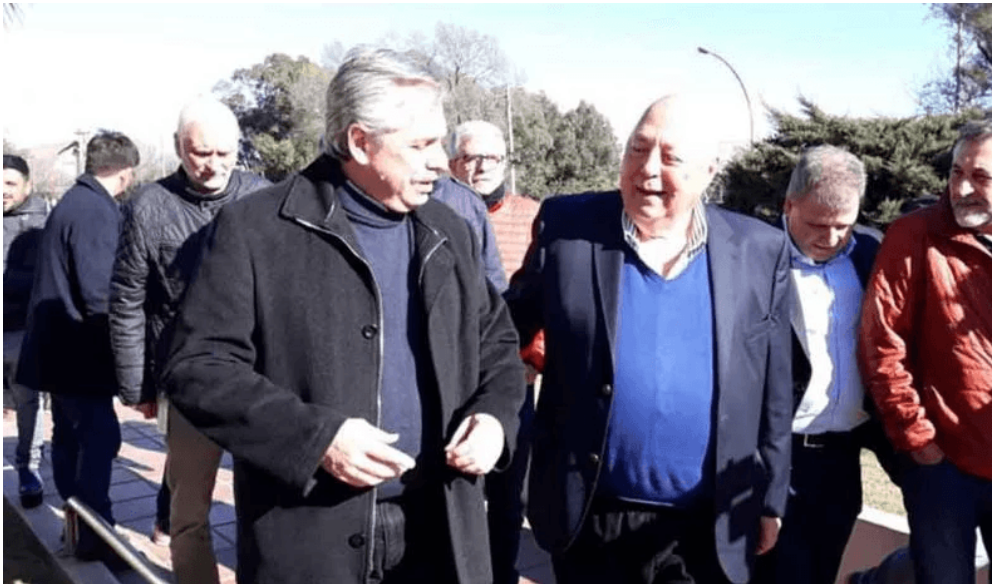
Foto de archivo de 2019 de Alberto Fernández, el candidato de Roberto Urquía.

Entre 2003 y 2009 fue senador nacional por la delastotista Unión por Córdoba , pero integró el bloque kirchnerista del Frente para la Victoria . Y en 2019 trabajó abiertamente para la candidatura presidencial de Alberto Fernández . Sin embargo, pese a su ADN peronista, en 2025 no dudó en autorizar que el imperio aceitero AGD aportara un millón de pesos para LLA , el viernes 24 de octubre, previo a las elecciones legislativas de 2025. Si bien la cifra es insignificante, es un gesto hacia el gobierno ultra.