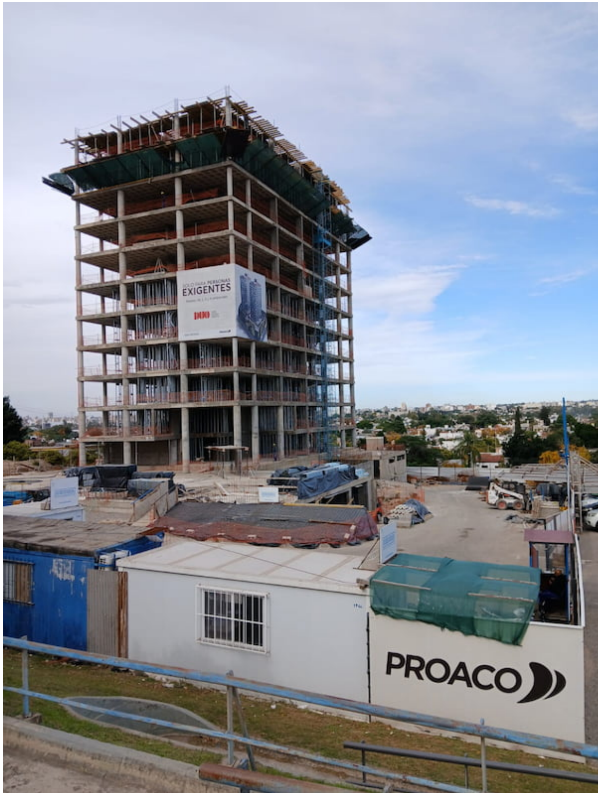
Una de las torres que construye Salim en barrio Villa Cabrera.

Violando toda norma urbanística, y contra la voluntad de los vecinos del barrio capitalino Villa Cabrera, Salim está construyendo un complejo de torres de 14 pisos, al lado de un shopping de Eduardo Elsztain , el magnate inmobiliario que financia y sostiene internacionalmente al régimen de Javier