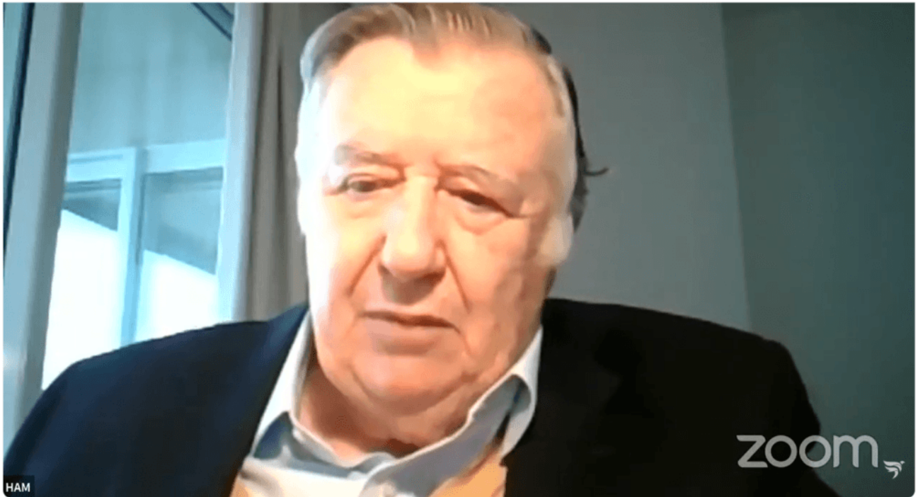
Héctor Mairal - El derecho administrativo como obstáculo para la libertad y el progreso