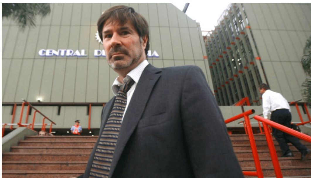
Fiscal Enrique Senestrari

Ante esta grave denuncia, que pondría en riesgo la golpeada obra social del estado provincial APROSS , el fiscal Senestrari , alegando que la maniobra descripta no era competencia penal federal -a pesar de que podría estar el delito de lavado de activos- se declaró incompetente y sugirió remitir el expediente a la justicia de Córdoba.