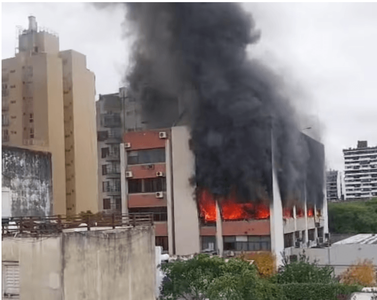
Incendio sede del APROSS 18/4/2024

inició en el segundo piso del edificio, donde se encuentran las auditorías médicas –que controlaban los pagos a BIOCOR SALUD SRL –, y se extendió hasta el cuarto piso , donde funcionaba el directorio integrado por Lucila Pautasso , esposa de Cassinerio , junto a su vocal del SEP, Villarreal . ¿Pura casualidad?