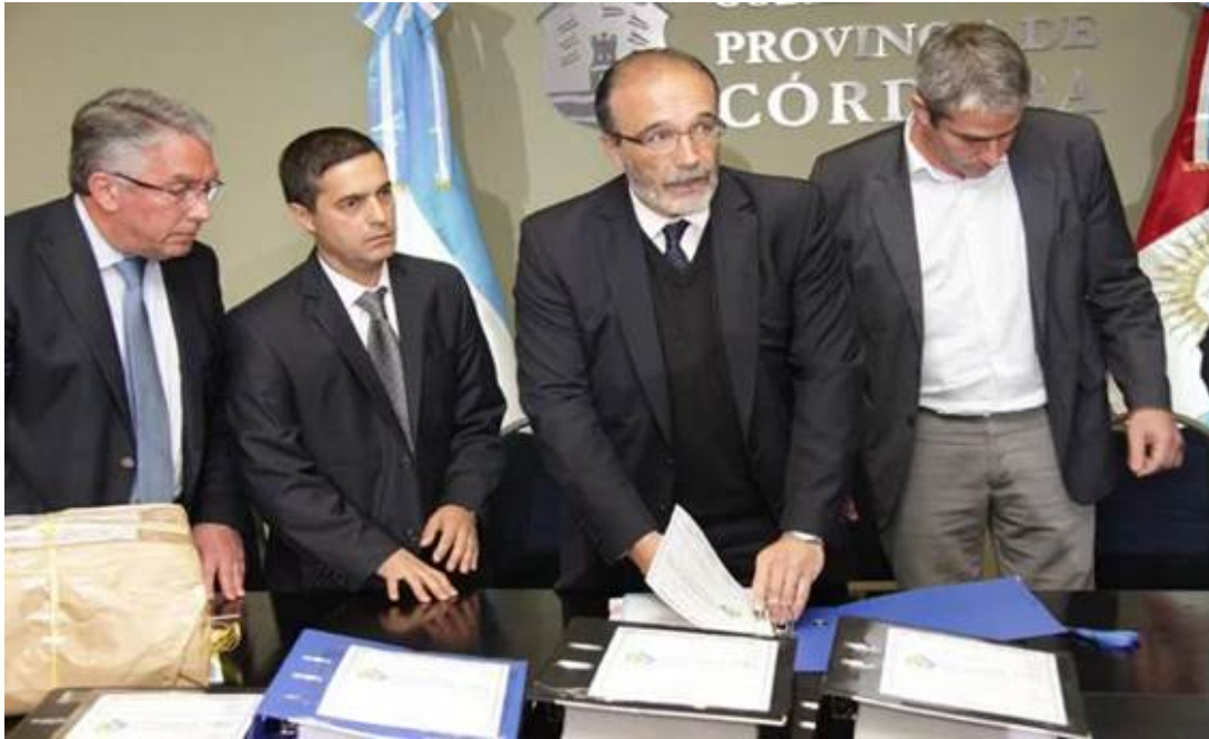
Foto de archivo del ministro López (carpeta en mano) al momento de adjudicar los gasoductos