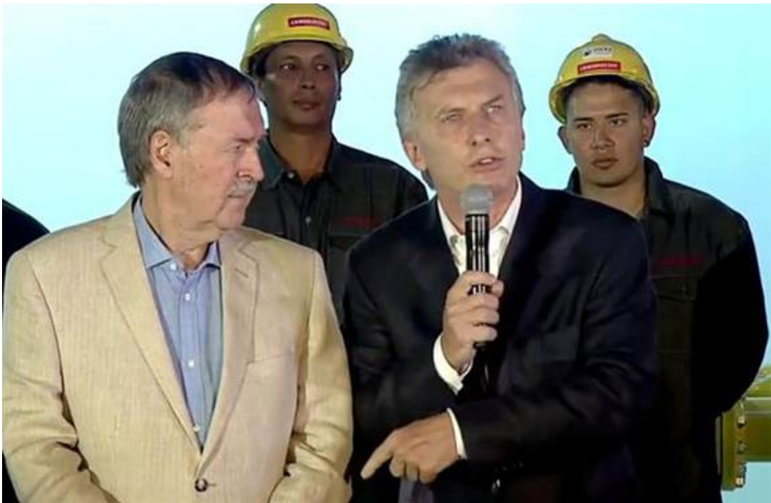
Schiaretti y Macri en la inauguración en La Calera, detrás, obreros con cascos de Odebrecht

Durante la gestión de Mauricio Macri en el gobierno de la Ciudad Autónoma de Buenos Aires, Puente Hnos. fue la encargada de colocar, a tasas altísimas en dólares, toda la deuda pública que emitió el PRO, en medio denuncias de irregularidades.