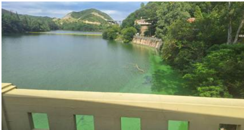
Lago San Roque, febrero de 2026. Foto del autor de esta nota.

Rodeado por localidades del sur del Valle de Punilla, la principal es Villa Carlos Paz, el embalse del San Roque padece desde hace décadas un proceso bioquímico llamado eutrofización o hipereutrofización: la proliferación de algas y cianobacterias que se alimentan de los restos orgánicos volcados sobre el lago; los que provienen en gran parte de desechos cloacales, sin el tratamiento sanitario adecuado.