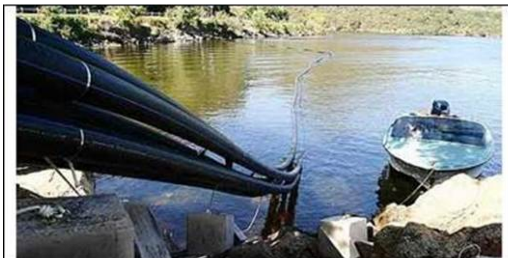
Foto de archivo de obras de aireación del lago