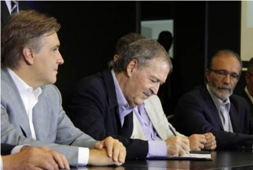
Foto 2016 de Llaryora (vicegobernador) y Schiaretti (gobernador) y Fabián López (ministro de Servicios Públicos).

Como socio del clan Astori jugó la constructora Chediack, cuyo titular del mismo apellido es de los confesos pagadores de coimas en el escándalo de las fotocopias de los Cuadernos, donde también está procesado José López, y es el caballito de batalla de Comodoro Py, o Comodoro PRO, como se conoce en el ambiente político a esta terminal judicial manejada por Mauricio Macri.