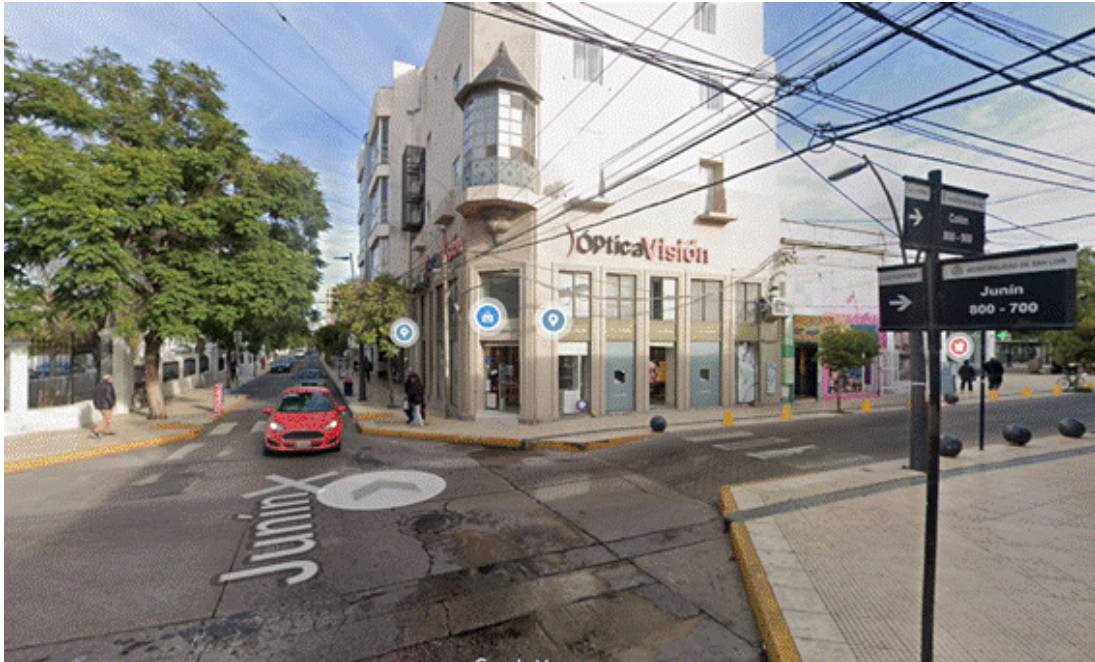
Calles Junin y Colón, capital de San Luis, donde Castresana tenía una casa

Y lo mismo hace con las acciones, que Castresana dice tener en su empresa NDC SRL : en 2015, mientras era vendedora monotributista de ropa, la esposa de Cid declara poseer el 50% del capital accionario de esta empresa, por un valor de $ 150.000 o USD 16.269 de entonces.