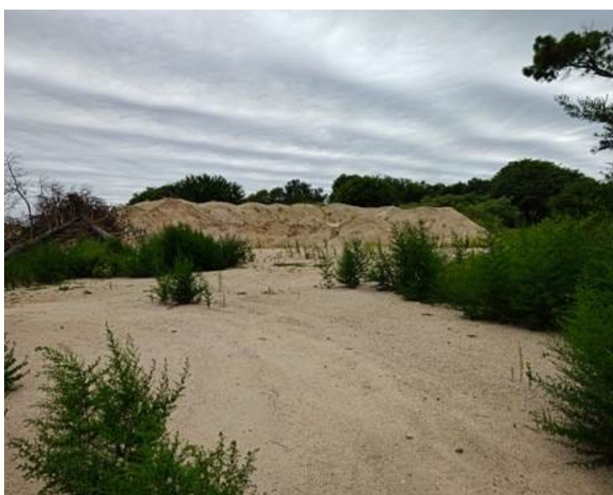
en la cantera colindante al Río Xanaes

Por esta razón, ejerciendo el derecho al acceso a la información pública, la autora de esta nota ingresó un pedido por mesa de entrada de la Municipalidad de Río Segundo, para saber si existen canteras en este momento extrayendo arena en las inmediaciones al río Xanaes; si las mismas están registradas en Minería de la Provincia; si hay estudios de impacto ambiental; y demás precisiones.