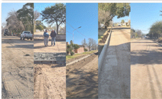
CORDONES Y BADENES BARRIO FCO. MARTINEZ RIO SEGUNDO.