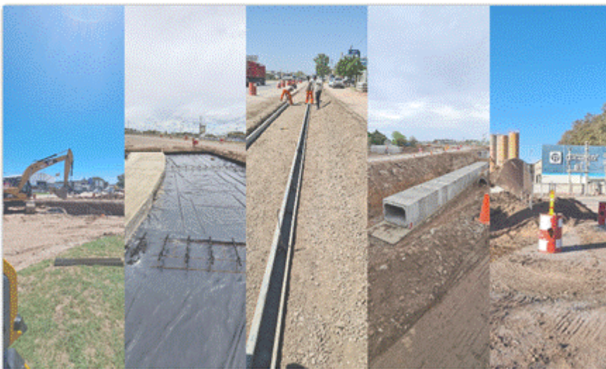
DUPLICACION DE CALZADA Y ROTONDAS RUTA NACIONAL 9