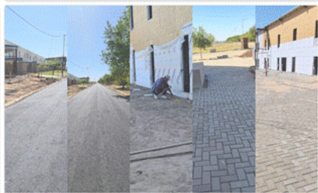
PAVIMENTO Y ADOQUINADO COMPLEJO NORTE RIO SEGUNDO.