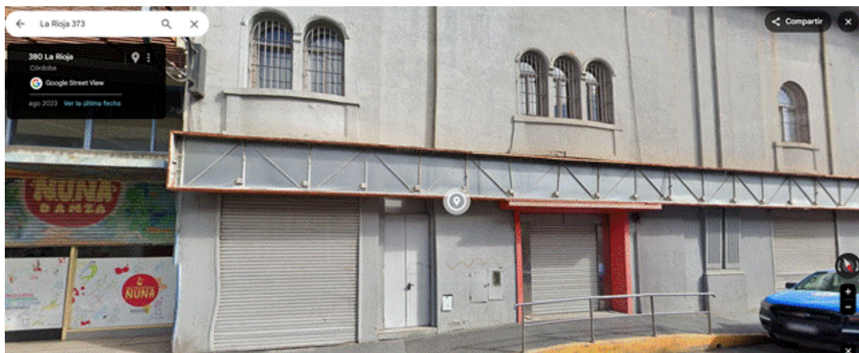
La Rioja 373 casi Sucre según Google Street View (junio de

Esto contradice con lo que consigna el propio Hormaeche, en base a las Cláusulas Primera, Sexta y Séptima del contrato, donde se asevera que el establecimiento se encuentra en buen estado. La denuncia apunta que a “tres meses y medio de haber contratado, el Ente ya se había obligado a pagar casi 50 millones de pesos por un inmueble que, según el propio Municipio, no se encontraba en condiciones de ser utilizado” .