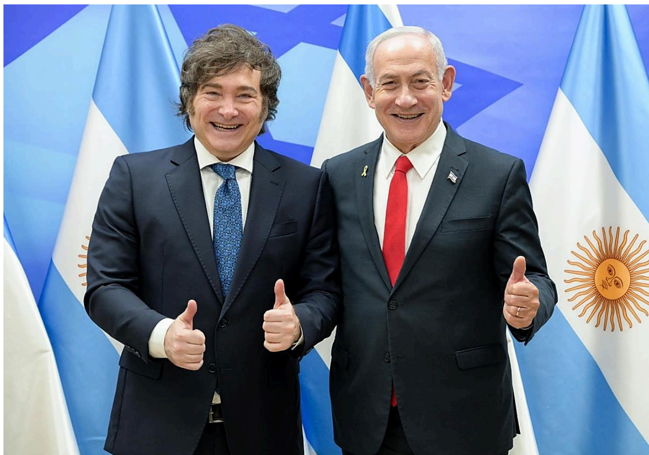
Javier Milei y Benjamin Netanyahu

cooptado por la CIA y el Mossad, fue creada en 1946 por Juan Domingo Perón bajo el nombre de Coordinación de Informaciones de Estado (CIDE). Su objetivo era recopilar, analizar y difundir información –pública y secreta– para la seguridad nacional.