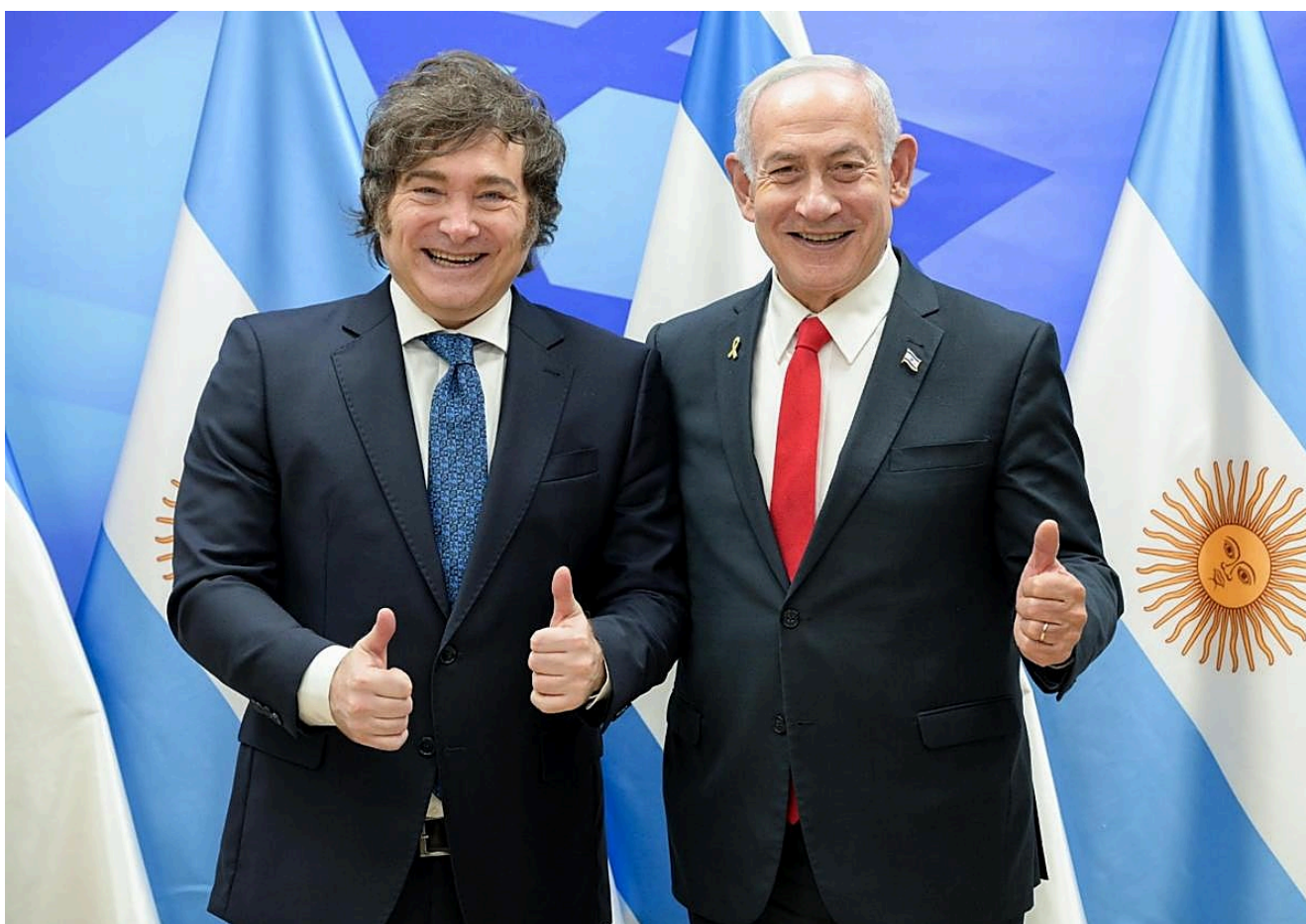
Javier Milei y Benjamin Netanyahu

La SIDE, el organismo de inteligencia con el mayor presupuesto de la historia argentina, señalado desde hace años por estar cooptado por la CIA y el Mossad, fue creada en 1946 por Juan Domingo Perón bajo el nombre de Coordinación de Informaciones de Estado (CIDE) . Su objetivo era recopilar, analizar y difundir información –pública y secreta– para la seguridad nacional.