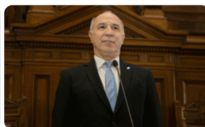
Ministro Ricardo Lorenzetti

Los tres cortesanos, según la página web de la Corte.