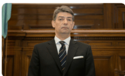
Presidente Horacio Rosatti

(A)NARCOMILEÍSMO:¿Los narcos llegan hasta la Corte, el ministerio de Bullrich, la SIDE y el Triple Crimen?