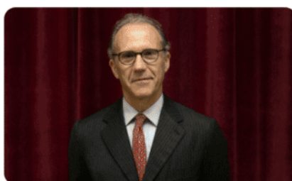
Vicepresidente Carlos Rosenkrantz