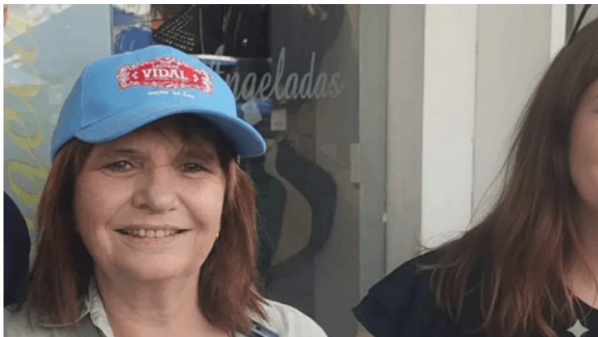
Foto de archivo, difundida en las redes, donde Bullrich porta una gorra de Lácteos Vidal.

Aún hoy, los principales medios como Clarín, La Nación e Infobae, como así también sus respectivas señales audiovisuales, siguen invitando a Alejandra a sus estudios para exponer su versión de los hechos. Y más todavía cuando el actual presidente, Javier Milei, prometió relanzar la reforma laboral después de las elecciones.