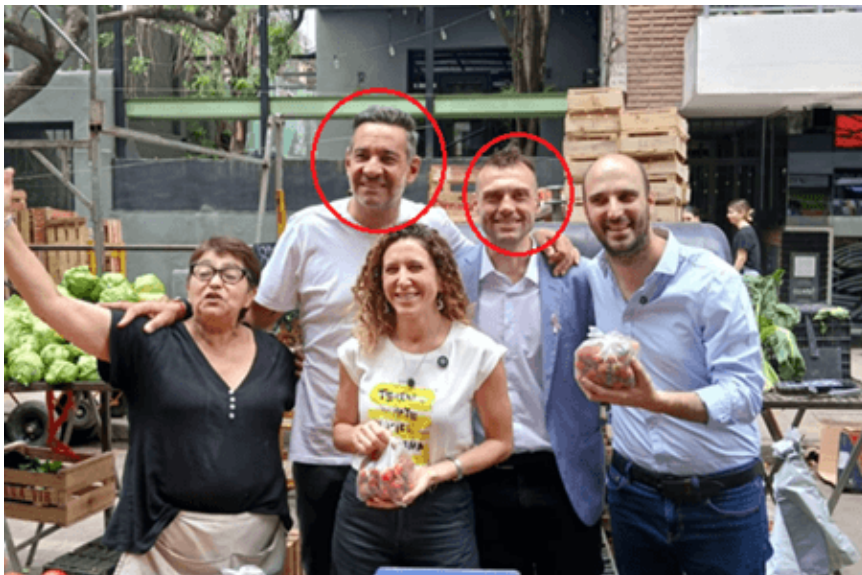
Siciliano y Hormaeche junto hoy en las campaña para diputado nacional