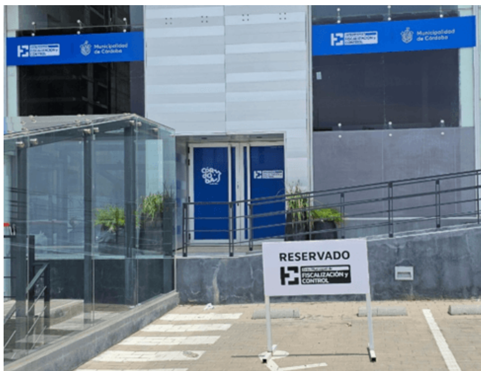
Oficinas del nuevo Ente Control y Fiscalización