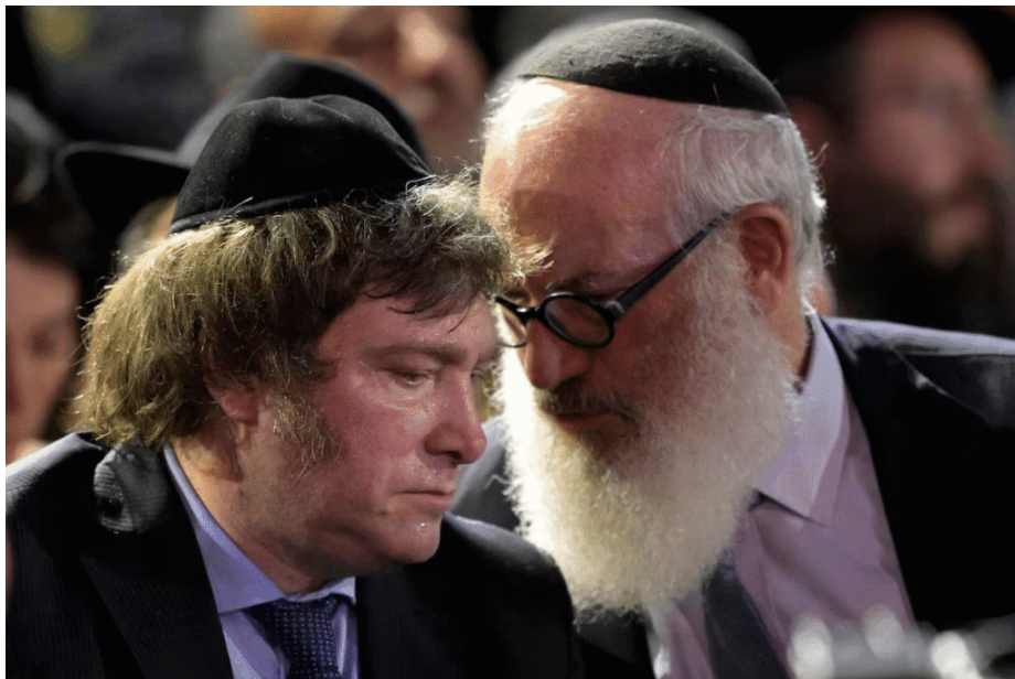
Presidente Javier Milei y Eduardo Elsztain

El gobierno naturalmente incluyó a Tandanor dentro de las empresas a privatizar en la Ley Bases, ley que, no olvidemos, fue redactada en el Hotel Alvear , propiedad del mismo Elsztain . Quien ejerce una notable influencia en el presidente Milei , como se puede apreciar en la siguiente imagen. Al haber sido quien lo introdujo en la secta fundamentalista judía Jabad Lubavich.