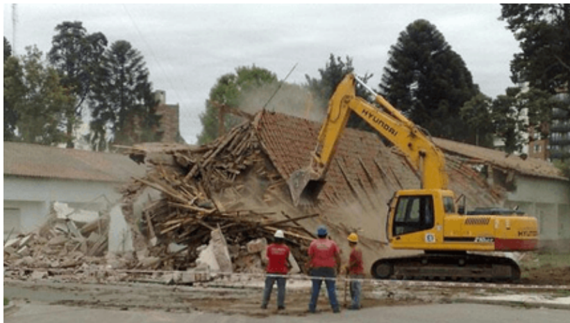
Demolición de la “Casa de las Tejas”

cuadrados a la universidad nacional estatal vecina.