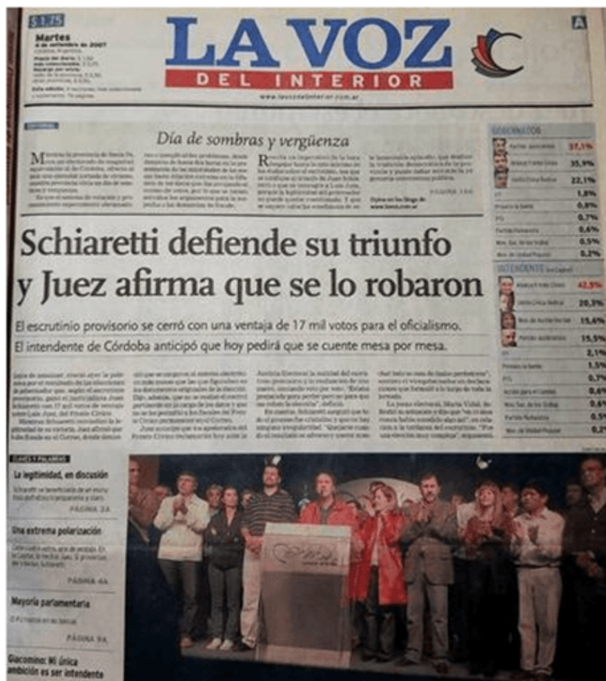
Tapa del diario La Voz del Interior del martes 4/7/2007