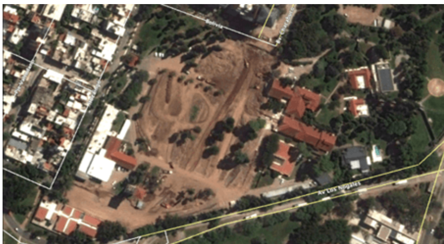
Imagen aérea de la Casa de las tejas antes y después de ser demolida