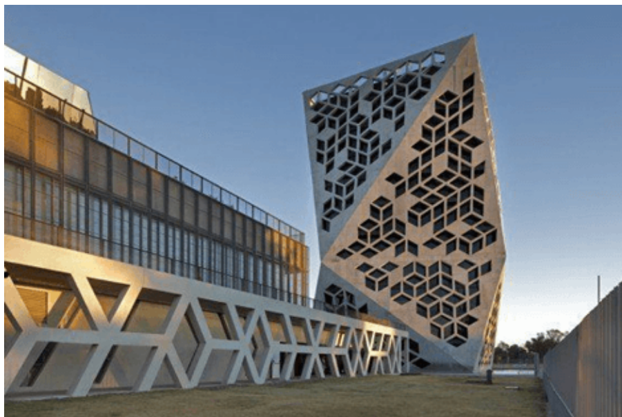
Centro Cívico Bicentenario

ocurre construir un centro cívico de 427 millones de pesos” agregó.