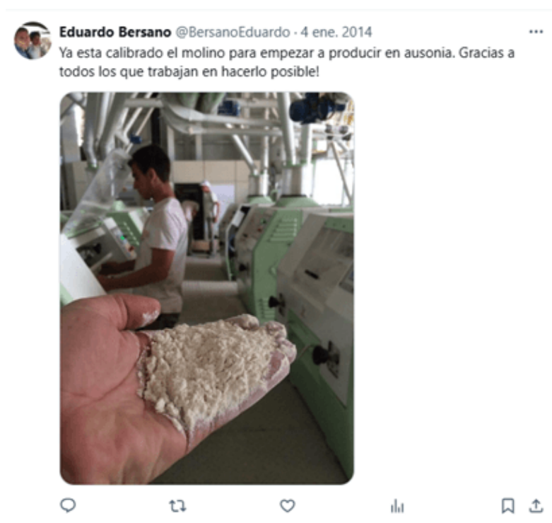
Cuenta de Twitter de Bersano.

año siguiente, también se trasladaron allí las oficinas de Alimentos Mediterráneos SA . Para diciembre de 2013, Bersano inauguró en Ausonia la primera etapa de la fábrica de pastas.