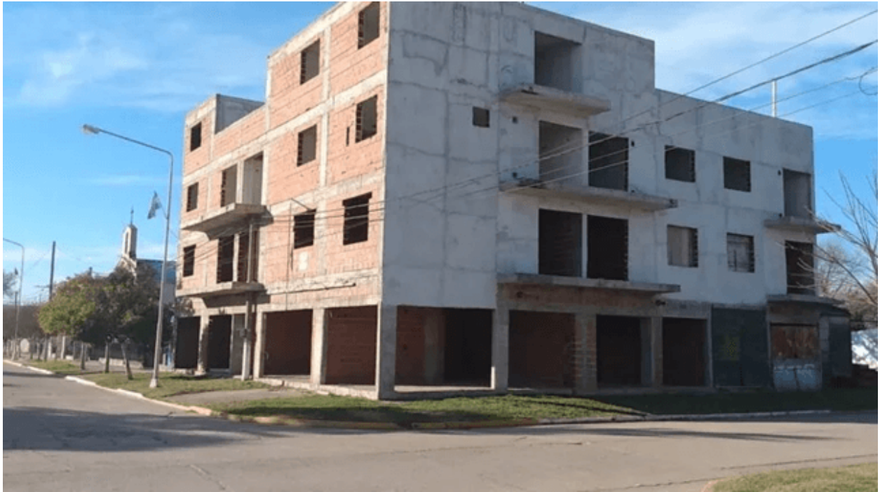
Hotel de Alimentos Mediterráneos.