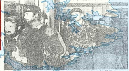
Cuatro soldados británicos que integran la dotación fija en las Malvinas en el aeropuerto de Exeter, adonde llegaron transportados por la Fuerza Aérea Argentina.