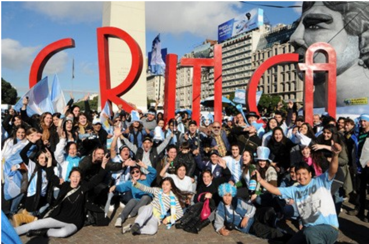
Foto de archivo de la pelea de trabajadores de Crítica.