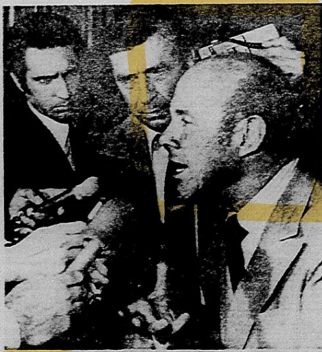
Costa Méndez en la conferencia de prensa que convocó para referirse a la nueva actitud argentina respecto de las negociaciones en torno del conflicto en la zona del Beagle.