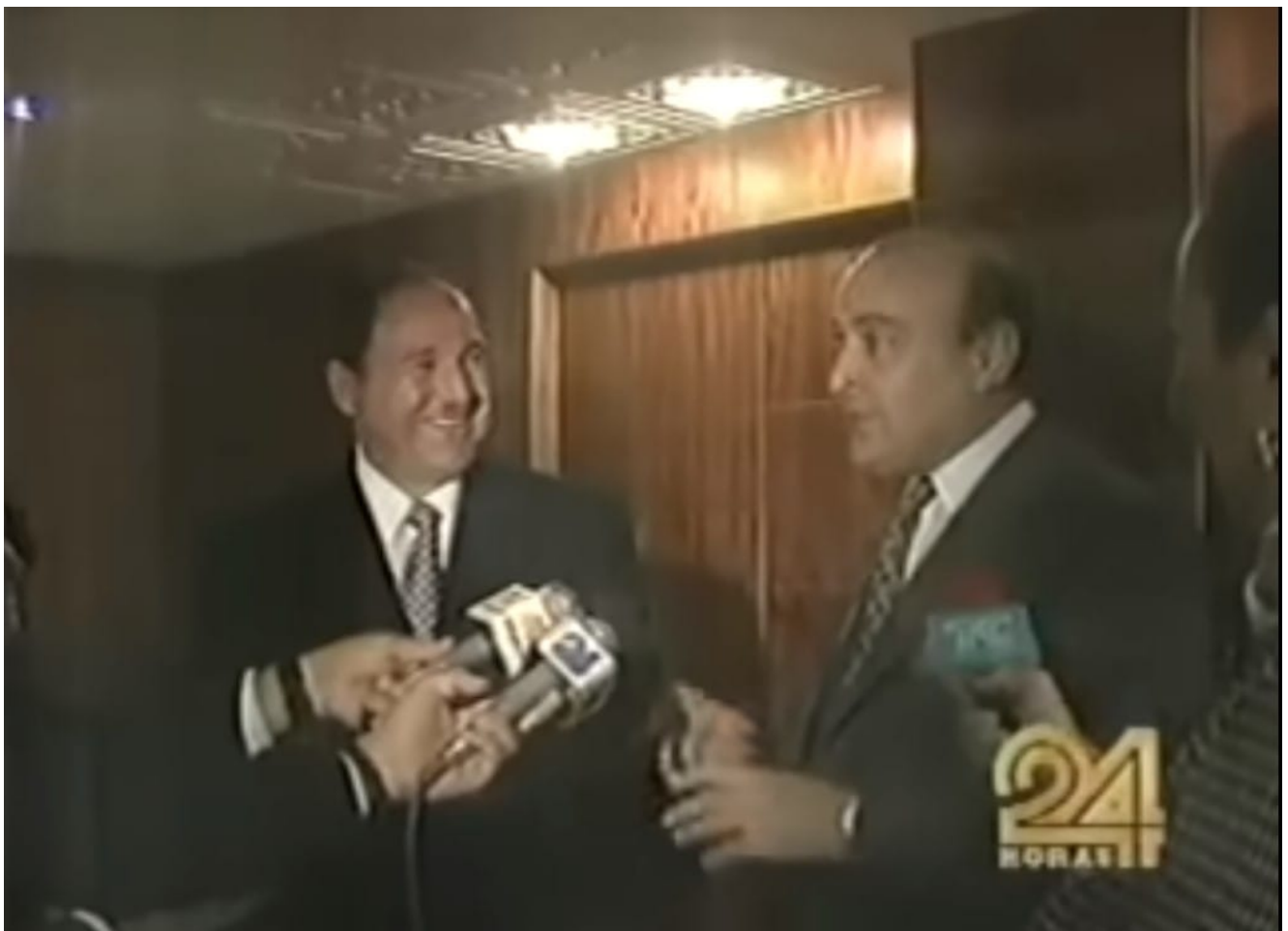
Abdala Bucaram y Mingo Cavallo.

Como dijimos, su gestión duró exactamente 180 días, pero hubo que esperar hasta el día 113 para que anunciara su paquete de medidas. Al igual que Menem, que prometía la revolución productiva y el salarizado, o si se quiere su gran seguidor Milei, que prometió que el ajuste lo iba a pagar la casta, el Loco ecuatoriano prometió por izquierda y ejecutó por derecha. Ya que para ello, recibió el asesoramiento económico del ex ministro de Economía de Argentina, Domingo Felipe Cavallo, el padre de la Convertibilidad argentina, que supuestamente iba a durar mil años.