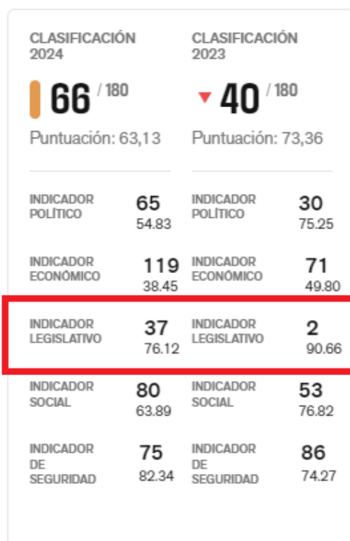
Indicadores de Argentina 2023 – 2024

Tal es así que en el indicador específico de lo legislativo, es decir, la ligada a las normas y leyes, vemos que pasamos del puesto 2 al 37, un enorme retroceso. El freno del mismo se le suma a las escasas herramientas políticas actuales para lograr una mayor pluralidad de voces.