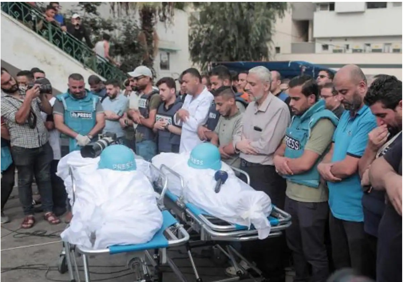
Periodistas en el funeral de dos colegas fallecidos por un

El ejemplo más palpable son los ataques bélicos en la franja de Gaza, comandadas por Israel, que “ha supuesto un número sin precedentes de ataques contra periodistas y medios desde octubre de 2023: más de 100 reporteros palestinos han sido asesinados por el ejército israelí, de los cuales al menos 22 se encontraban en el ejercicio de sus funciones” .