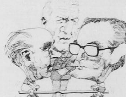
Ministro Alemann, Presidente Galtieri, Ministro Garrido

estado de conciencia autocrítica del poder militar. Aceptó que el desastre sufrido ha sido grande y que por lo tanto "ello no nos permite arriesgar lo que resta". Un tiempo político? (Un espacio político?) Ambas cosas al mismo tiempo? También es ineludible comparar este tono con aquel que se usó inicialmente cuando se proclamaba que las 500 horas objetivos y no plazos. Es claro que Galtieri no dice nada nuevo, pero sus repetidas menciones — como importan un virtual reconocimiento de que, aunque habiendo objetivos, aunque está vez con compromiso a término.