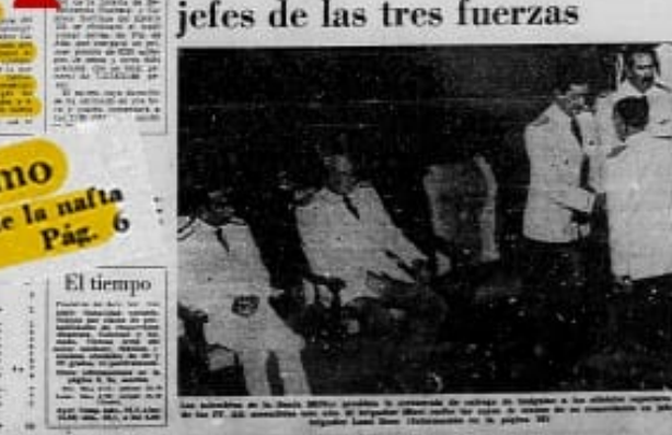
Los jefes de las tres fuerzas recibieron sus insignias en un momento de la ceremonia de inauguración del colegio de cadetes.