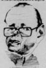
Los reglas de juego