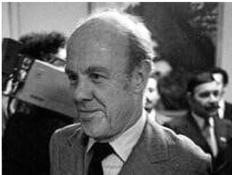
Nicanor Costa Méndez

así. Los rasgos son más vale groseros, la mirada no demuestra una inteligencia muy aguzada, los labios son espesos y sensuales, la frente más vale escasa y fugitiva, la nariz ligeramente respingada, pero fuerte y dominante”.