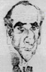
Dr. Juan Manuel de Rosas