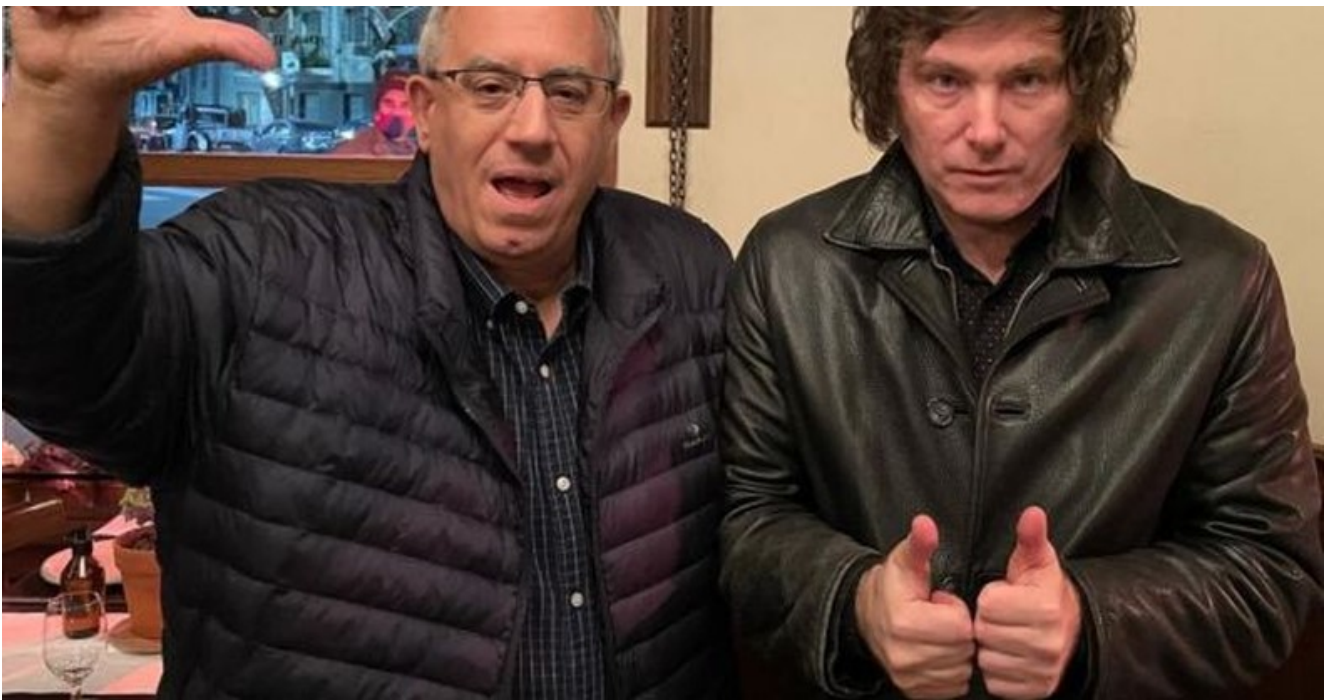
Milei y Maslatón, otro crítico del actual gobierno

-Así es. Y querían boludos útiles como yo. O como Carlos Maslatón. Pero estos boludos útiles se enteraron a tiempo. Nos enteramos durante la campaña diputados nacionales en 2021 y nos abrimos. Más que nada porque somos gente de bien nacida y argentinos de bien.