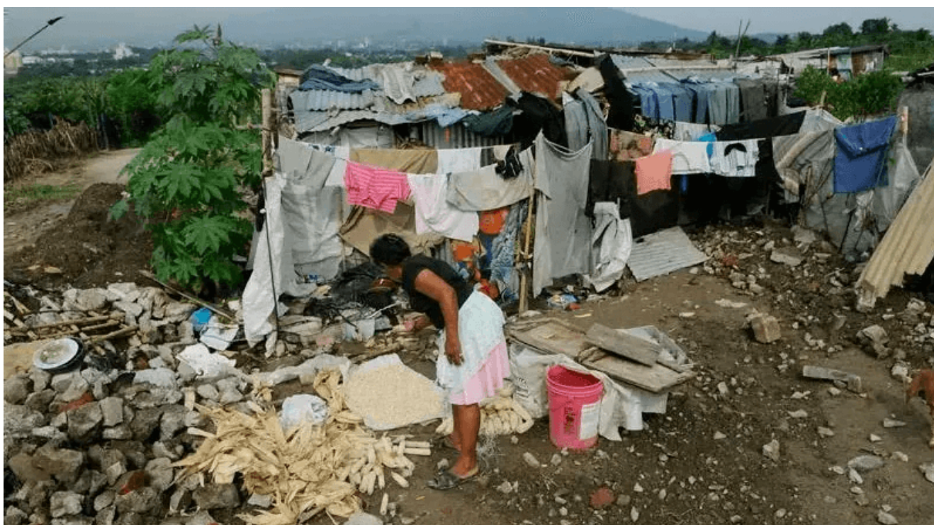
Barrio del Salvador

Todos estos guarismos muestran que, al igual que otros países de la región, El Salvador, un país que tiene su economía dolarizada, 28% de pobres extremos, la tasa de presos más alta del mundo y un PBI cuyo 25% lo componen las remesas giradas por los propios emigrantes del exterior, está colapsado. Y que la supuesta hegemonía de Bukele no es tal y todo allí pende de un hilo. Quedando como único plan político la mano dura extrema, sin derechos y garantías para nadie.