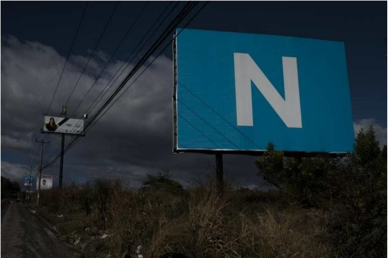
Publicidad callejera de Nuevas Ideas de Bukele

Respecto a los recursos públicos para la campaña, única forma de financiamiento con la que cuentan el partido político de la oposición en el Salvador, ésta se determina mediante adelantos de dinero llamado “Cuota Política” calculados en base a los votos obtenidos en la campaña anterior. Un sistema que esta vez, según recolectó la OEA fue lento y complejo en trámites burocráticos que regulaba Bukele. Y que solo un partido pudo alcanzar.