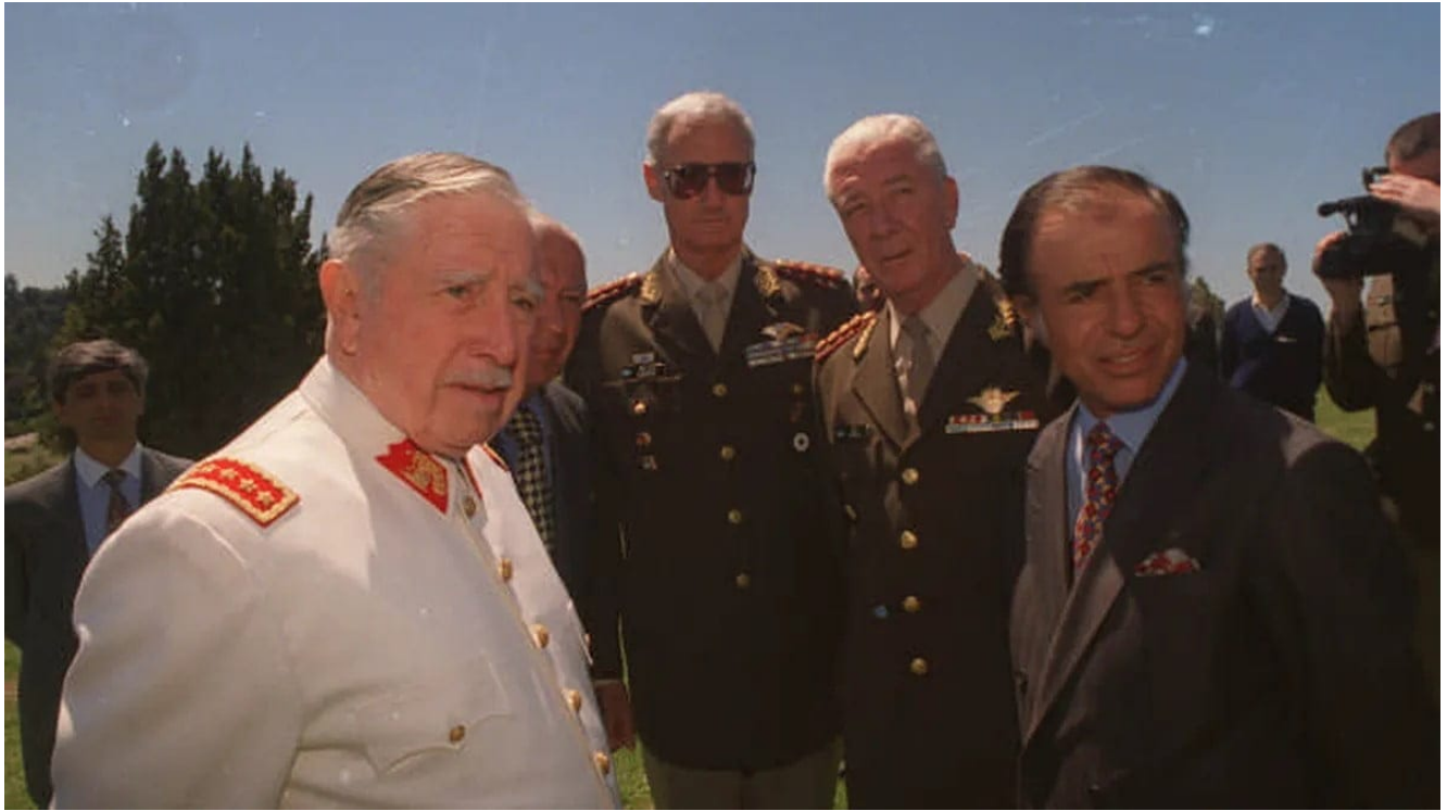
Grales Augusto Pinochet y Martín Balza y presidente Carlos Menem

Ver La deuda externa sucia que apareció entre el conato de guerra con Chile y la guerra de Malvinas