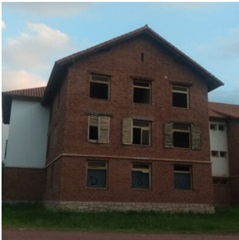
Hotel Nro 5 de Embalse