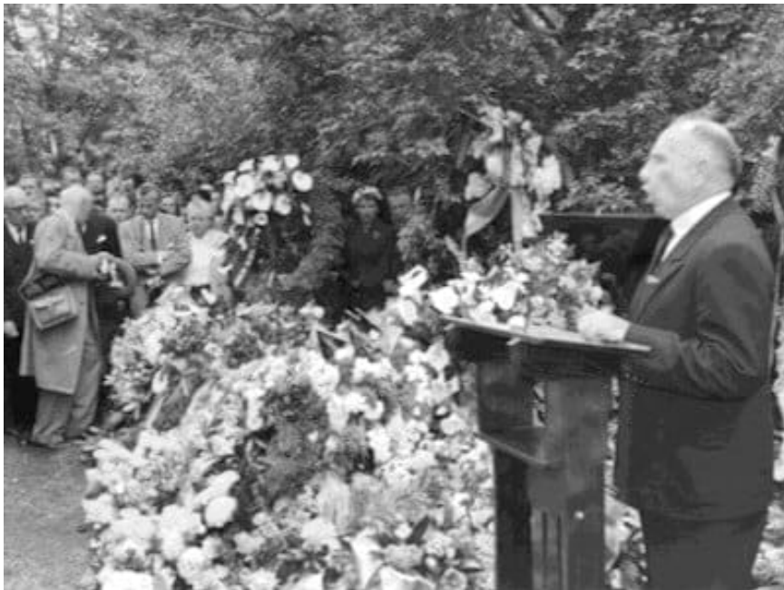
Stepan Bandera durante su exilio, celebrando la memoria de Yevhen Konovalts.

Pero ya era demasiado tarde. El Reich se derrumbó. Los anglosajones obtuvieron Dontsov, Bandera y Stetsko. El teórico del nacionalismo integral fue trasladado a Canadá, mientras que los dos practicantes del asesinato en masa fueron trasladados a Alemania. El MI6 y la OSS (antecesora de la CIA) reescribieron sus biografías, haciendo desaparecer su implicación nazi y su responsabilidad en la «Solución Final».