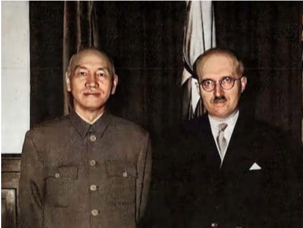
Chiang Kai-Shek y Yaroslav Stetsko en la fundación de la Liga Mundial Anticomunista.