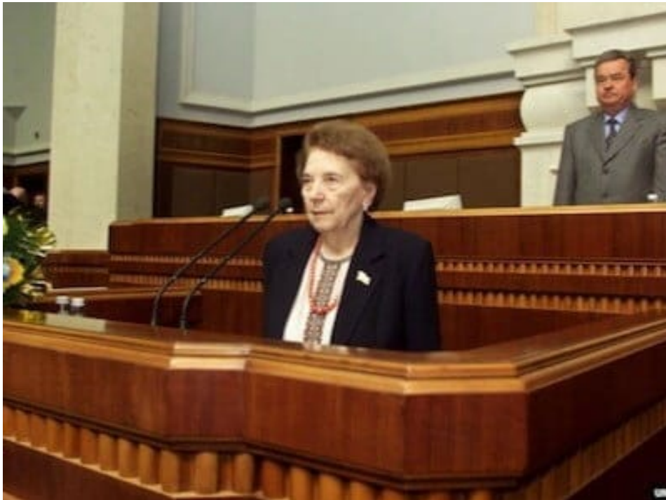
Slava Stetsko inaugurando la sesión de 2002 de la Verjovna Rada.

racial nazi todavía es proclamada por la Ucrania moderna como en los peores momentos de la Segunda Guerra Mundial.