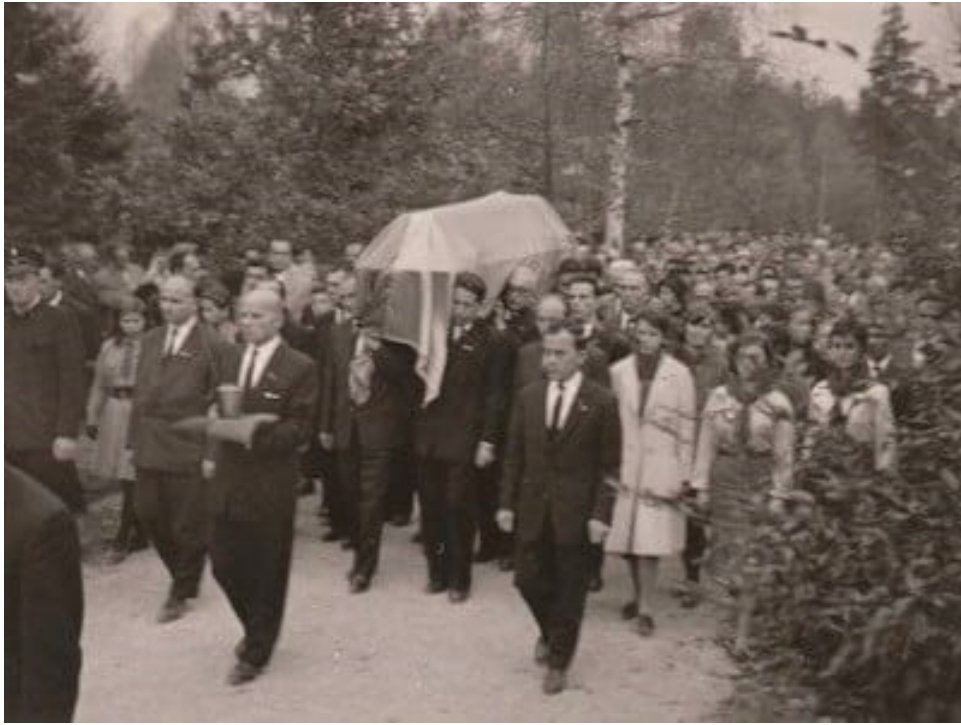
Funeral del Criminal de Lesa Humanidad, Stepan Bandera.