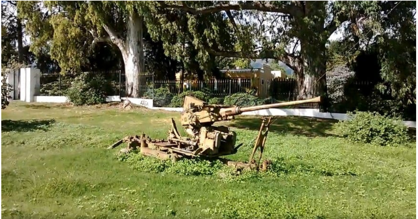
La batería antiaérea que defiende la mansión de González

Google Earth informa que esa propiedad tiene 62 mil metros cuadrados de terreno, o sea seis hectáreas, y su edificación principal cuenta con 600 metros cuadrados cubiertos. Según los viejos pobladores de San Javier, el veloz González compró ese castillejo a una baronesa chilena, pagando cinco millones de dólares por él.