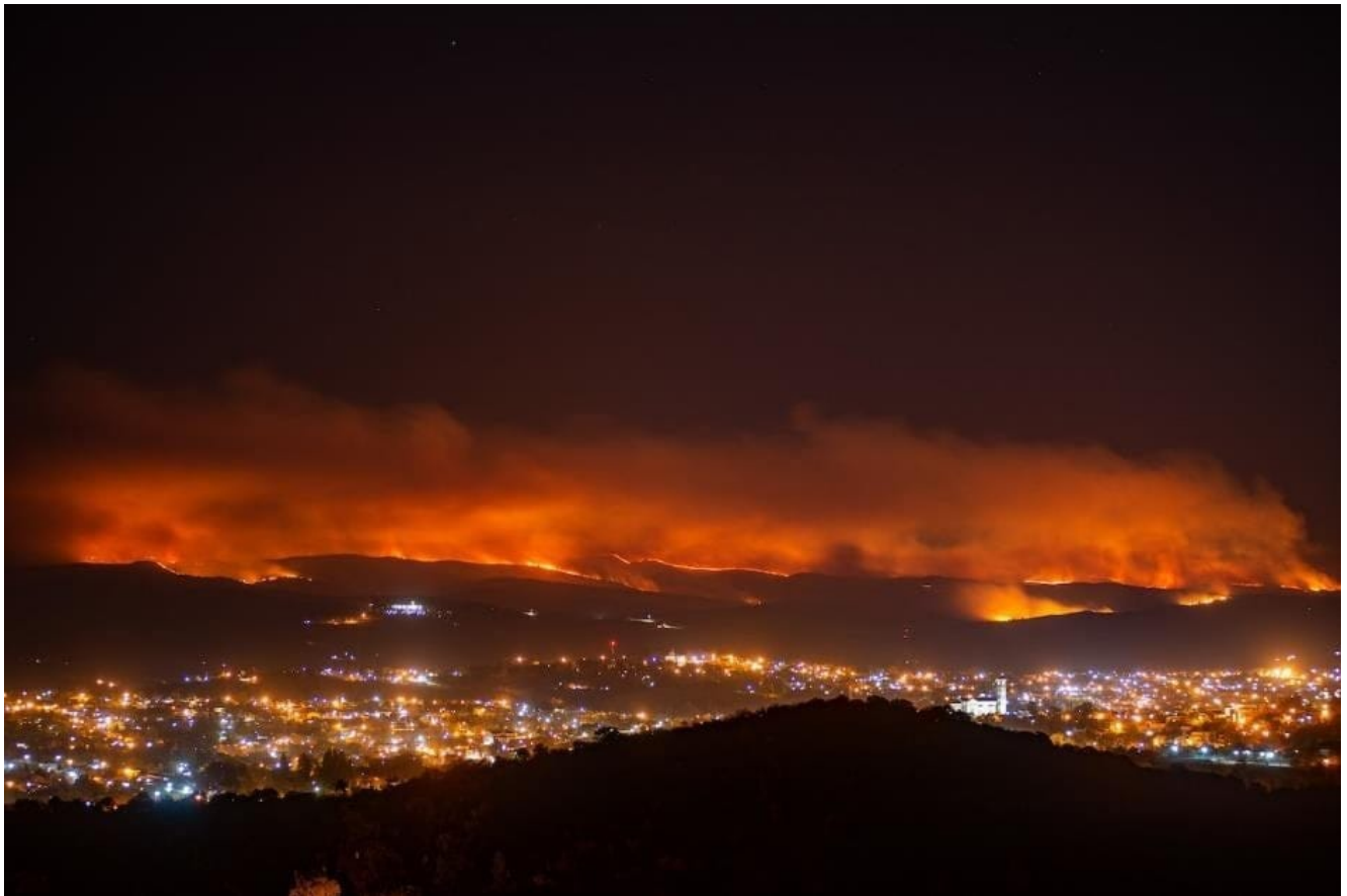
Incendio en la Pampa de Olaen, cercano a La Falda, Valle de Punilla.