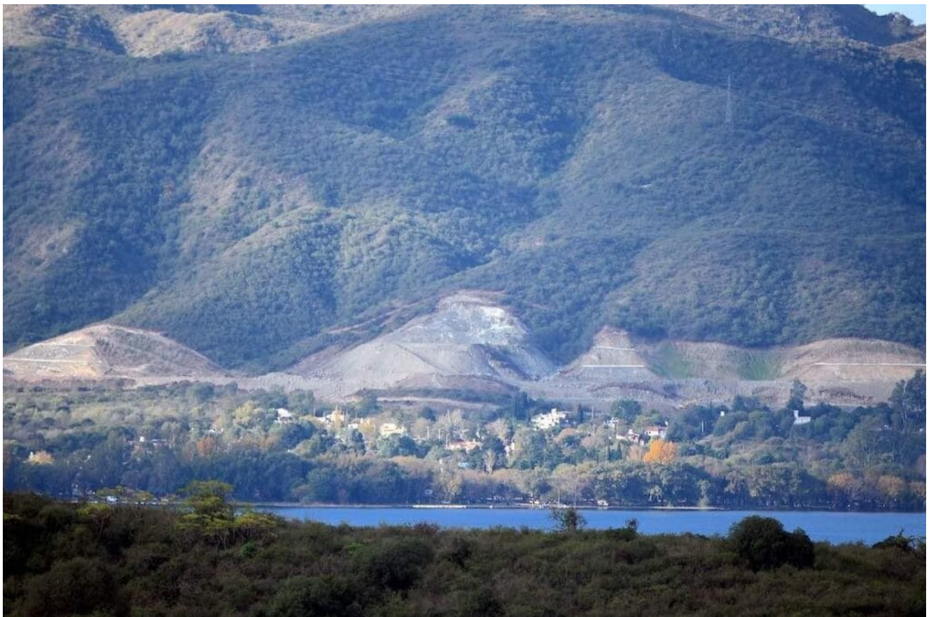
Vista del faldeo occidental de las Sierras Chicas y los efectos de la autovía.

Nuevos caminos salpican la geografía de las sierras. Son las llamadas «autovías» que van extendiéndose por dos nuevas trazas a través de los valles de Punilla y Calamuchita, con obras en ejecución; hay además otros proyectos en estudio. En la llamada Autovía de Punilla los daños irreversibles del primer tramo incluyeron un multimillonario puente sobre el Lago San Roque y la desfiguración de cerros enteros junto con la destrucción del bosque nativo en las laderas montañosas. Allí tampoco tuvieron lugar estudios arqueológicos y antropológicos.