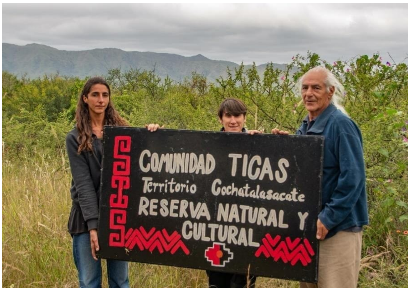
Pueblo Kamechingón de la comunidad Ticas, Valle de Punilla.

Brutalmente, el cordobesismo ha desarrollado una auténtica patología geográfica y medioambiental sin precedentes. Solo el interés de la ciudadanía y la organización en asambleas de base hacen frente a esta metodología antiecológica y antiambiental, en luchas callejeras y ocupación de territorios despojados. No extraña que, en muchas oportunidades, estas manifestaciones de rechazo ciudadano terminan en feroz represión.