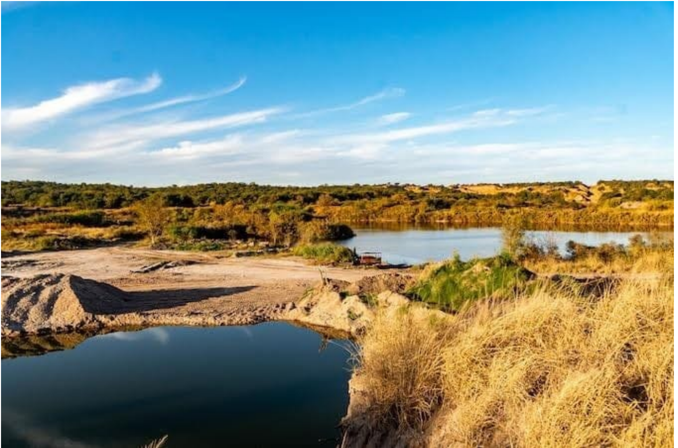
Extracción de áridos en Chacra de la Merced.

En Chacra de la Merced, la extracción de áridos (arenas y cantos rodados) reemplazó al cinturón verde ante la elevada contaminación del agua. La ciudad dejó de autoabastecerse de verduras. Las canteras producen alto impacto antrópico, como la formación de hondonadas y lagunas.