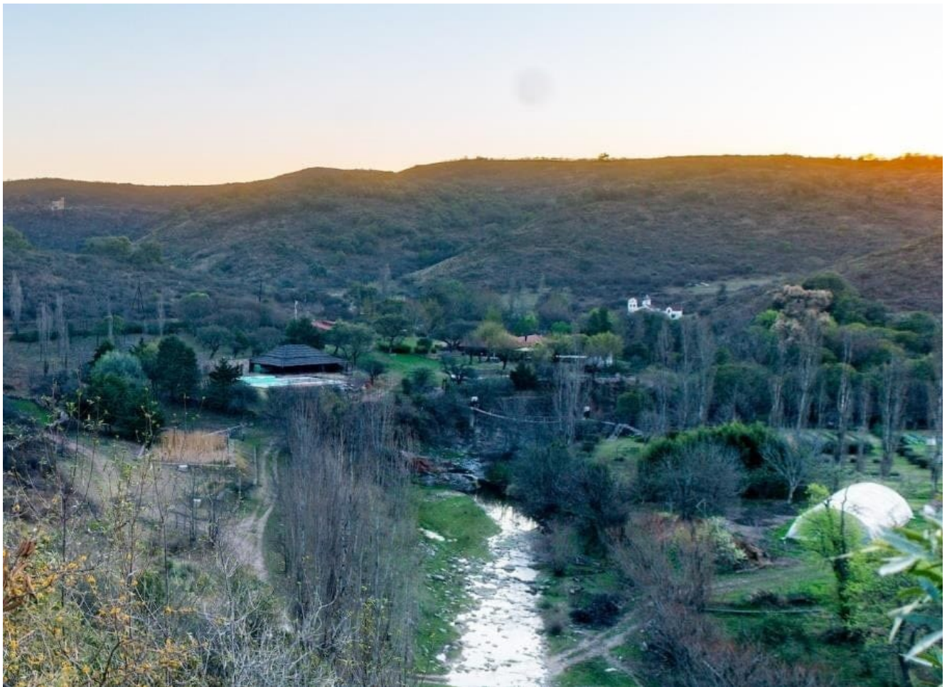
Capilla Histórica de Candonga.

la amenaza de la construcción de otra autovía. Es un mismo modelo que aplica el gobierno provincial; todas las cuencas están siendo devastadas; buscan destruir el ambiente para dejar todo a los poderosos. Ellos vienen con actitud de violencia, con hechos consumados; las medidas cautelares y los amparos no se resuelven en la justicia y mientras tanto continúan avanzando; no nos escuchan. Por eso nos manifestamos, para visibilizar la situación, para que la comunidad sepa que el gobierno provincial nos violenta y la justicia no resuelve a tiempo. Que hay un sinnúmero de irregularidades. (Comunicación personal)