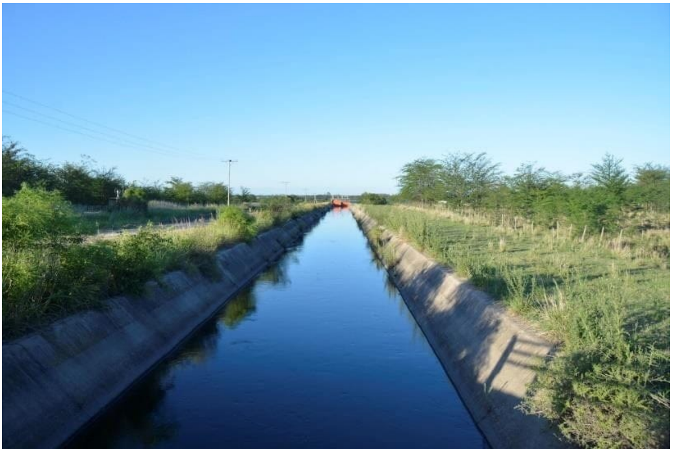
Canal a cielo abierto de Los Molinos-Córdoba

Sin embargo, el gobierno provincial, asociado al de la Provincia de Santa Fe, acaba de firmar acuerdos que endeudarán a ambas jurisdicciones en más de 500 millones de dólares y traerán agua desde el río Paraná, uno de los más contaminados del mundo. Nótese que es la opción más costosa ya que implicará bombearla para subirla más de 300 metros de desnivel que existe entre el Paraná y Córdoba. Esto, a su vez, significará enorme gasto energético. No se conocen cifras oficiales de tal costo. Insustentable.