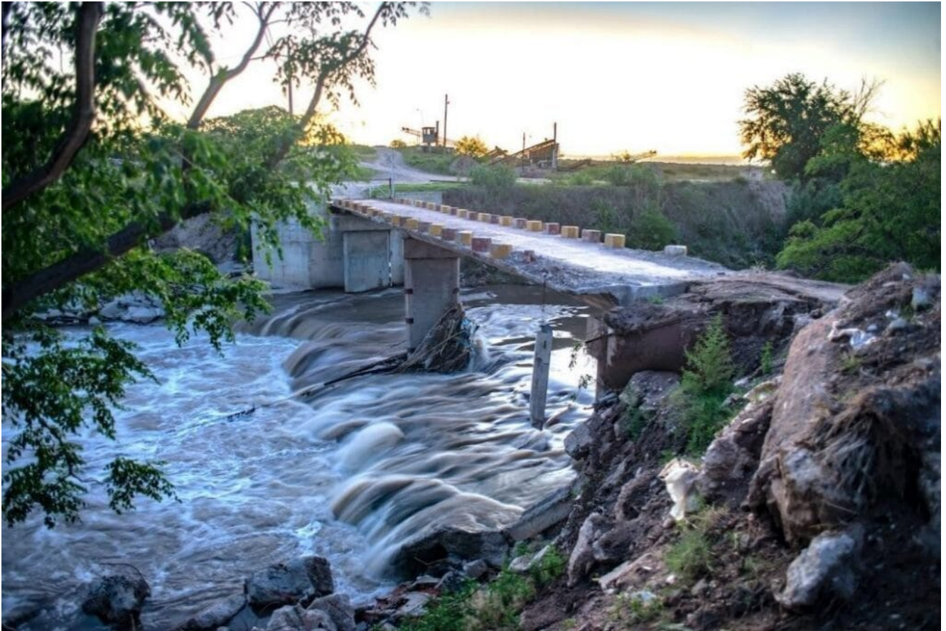
Puente Tegli sobre el río Suquía

Allí él explica: cuando la planta de tratamiento de líquidos cloacales colapsó, el agua sin purificar comenzó a infectar al río Suquía. Como consecuencia, hoy es un río muerto, un río de cloacas; el 75% de su agua proviene de los desechos industriales y humanos, no hay forma de vida compatible porque la carga orgánica de materia fecal y los residuos impiden que el río arrastre oxígeno disuelto y, por lo tanto, es imposible la vida. (Comunicación personal)