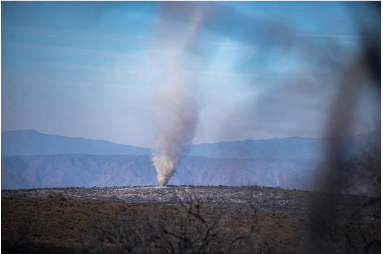
Incendios en el Valle de Punilla, 2020.

Cerca de ahí, al pie del Cerro Uritorco, los aviones hidrantes van y vienen combatiendo otro incendio: Laura, habitante de Capilla del Monte reflexiona: No hemos podido relajarnos, porque aún apagado el fuego debemos continuar con las guardias de ceniza. Si pudiéramos tomar conciencia y terminar con esta necesidad que tenemos con el ecosistema serrano, la biodiversidad... Hay que hacer un ordenamiento territorial del bosque nativo que sea participativo. Aquí, como se puede apreciar, los incendios se superponen. Esto también desmiente la afirmación oficial de que el gobierno reforesta, que va a hacer remediación de lo incendiado. Es solo para el momento. (Comunicación personal)