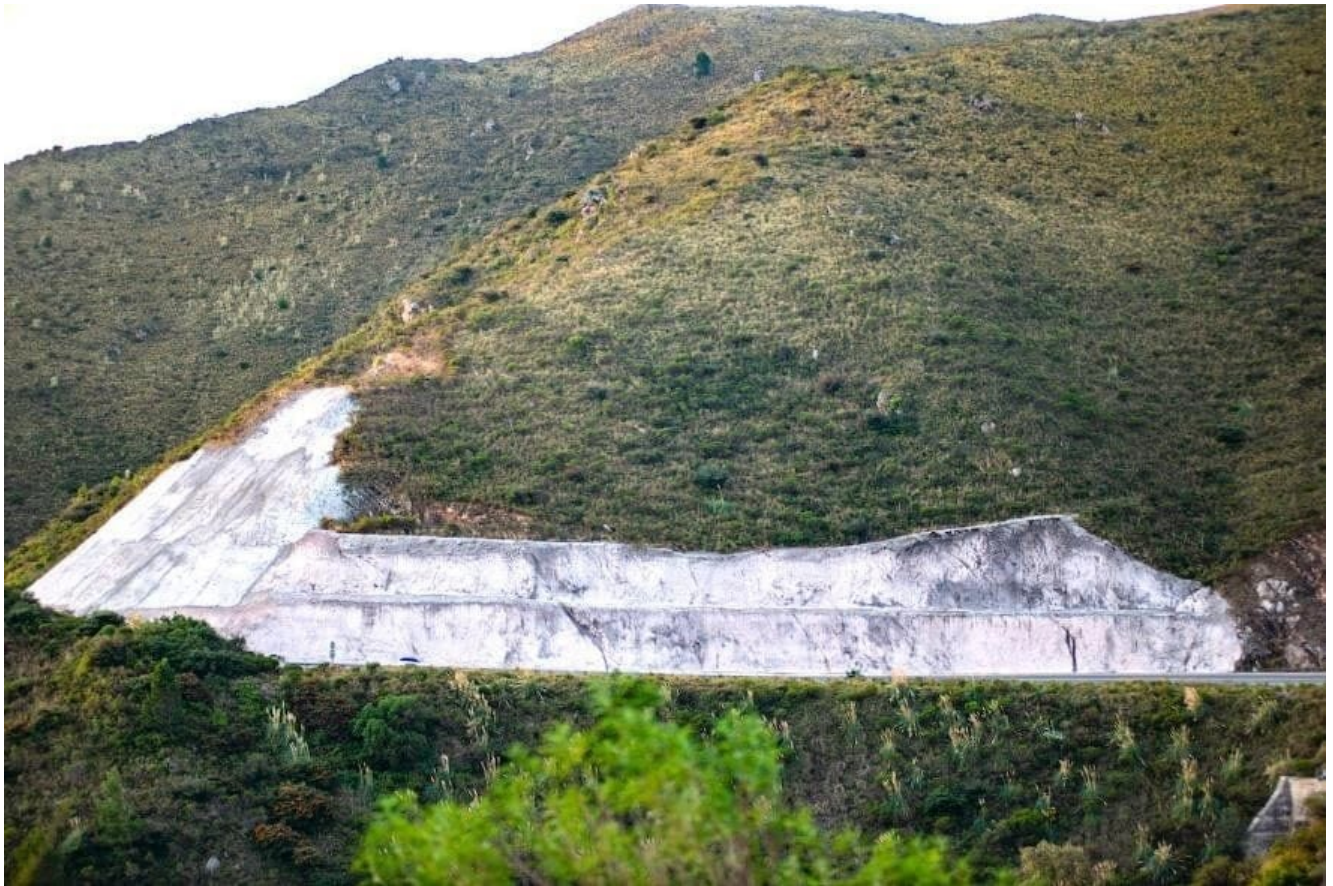
«Remediación» en el Camino del Cuadrado.

El problema del agua que afecta a la Humanidad como consecuencia del cambio climático y el calentamiento global implica que Córdoba, con apenas poco más de 80 metros cúbicos de agua superficial en toda su geografía, deba preservar el recurso y reciclar.