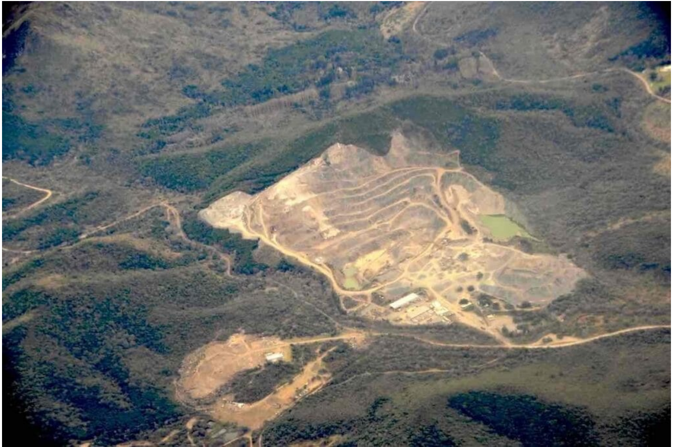
Mina El Gran Ombú, Sierras de Córdoba.

Es dable mencionar que, desde la geografía crítica, emplearemos el concepto de espacio geográfico con mirada holística y multidimensional. Esta geografía de la destrucción medioambiental que también afecta al resto de la Argentina no solo debe ser estudiada desde las condiciones físicas sino, especialmente, desde las relaciones sociales.