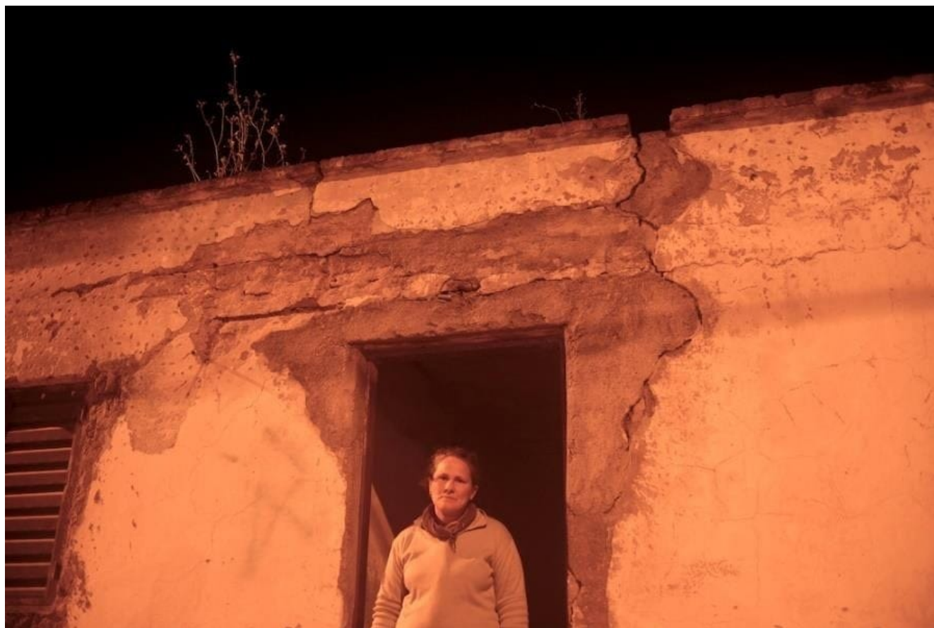
Villa El Libertador, ciudad de Córdoba.