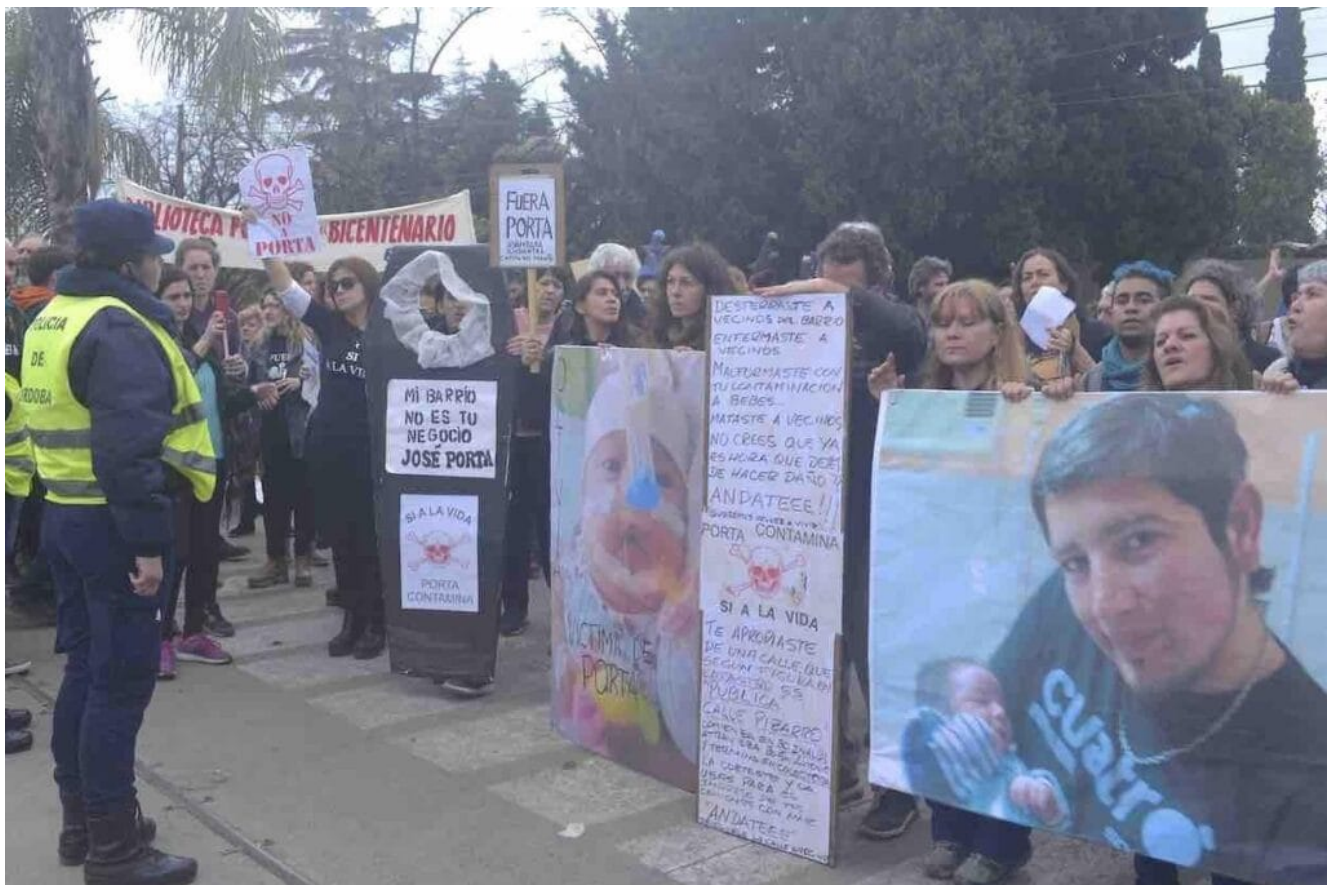
Protesta frente a la fábrica Porta Hnos, ciudad de Córdoba.

("Vecinos unidos en defensa de un ambiente sano") ante el peligro mayor que significa la planta de la empresa Porta Hnos. Tenemos que aguantar el olor nauseabundo, el escape de las válvulas, el ruido permanente, pese a que nosotros estamos mucho antes que ellos ¿Qué aire inhalamos permanentemente? porque esta fábrica no se detiene. Pese a los casos de cáncer, malformaciones, muerte súbita de niños, el estado (municipal, provincial o nacional) nos ha abandonado. El propio estado no hace cumplir las leyes y obligaciones para vivir en un ambiente sano. Estaría muy bueno que se fueran. (Comunicación personal) Comentan un grupo de mujeres frente a la empresa.