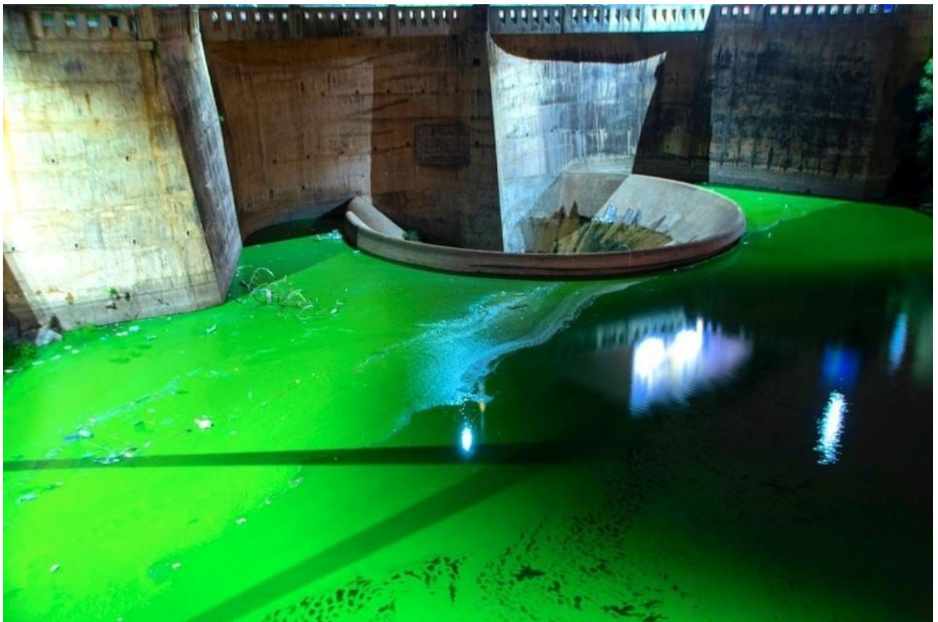
Dique San Roque.