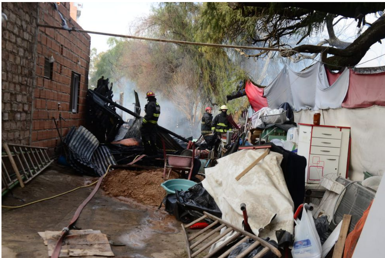
Trágico incendio en La Tablita

precaria. La tragedia llevó a discutir sobre la desigualdad habitacional y social reinante, en épocas de temperaturas a bajo cero, donde el ambiente entra en calor con las prioridades que a contramano con la realidad optan las autoridades.