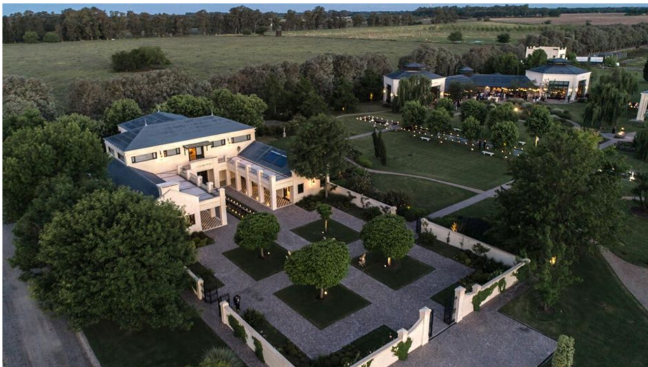
Campo Dok Haras donde se casó Lanata