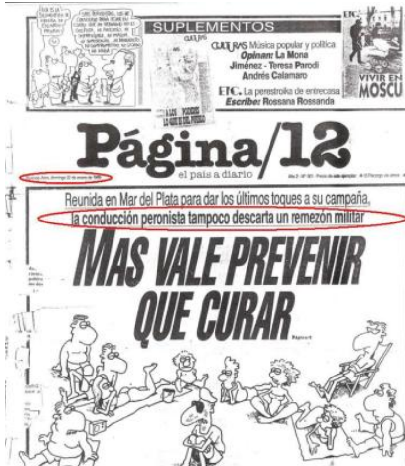
Tapa de Pagina 12 del 22 de enero de 1989 diseñada por Lanata

Este inusitado copamiento de La Tablada, terminó en una masacre. Donde el ejército jugando como el gato con el ratón, le tiró con todo a los novatos guerrilleros del MTP. Hasta bombas incendiarias. Y el anunciado golpe de Lanata y el perro Verbitsky no solo nunca aconteció, sino que fue un tiro por la culata, dado que la toma del cuartel luego se transformó en el principal argumento que esgrimió el presidente Carlos Menem para decretar el 29 de diciembre de 1990 los indultos a las cúpulas militares juzgadas y condenadas por Alfonsín. Entre estos Carlos "Pajarito" Guillermo Suárez Mason (decreto 2746/90). El principal hombre de Estados Unidos en las Fuerzas Armadas durante la dictadura.