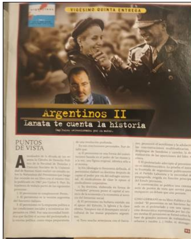
Revista Veintitrés del 23/3/2008