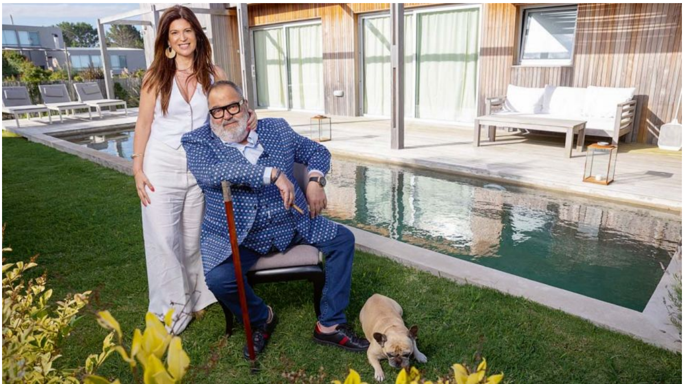
Casa de Lanata en San Ignacio de Uruguay, domicilio Legal