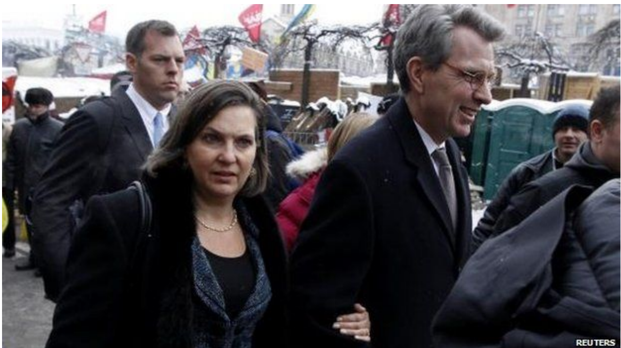
Victoria Nuland, Geoffrey Pyatt, Plaza Maidan, Kiev, 2014

Así se pudo ver a la subsecretaria de Estado Victoria Nuland, quien actualmente se desempeña como subsecretaria de Estado de Asuntos Políticos de Biden, y el entonces embajador de EEUU en Ucrania, Geoffrey Pyatt, paseando por la Plaza de Maidan en apoyo a los rebeldes.