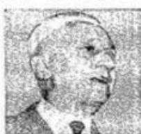
ARTURO ILLIA U.C.R.P.