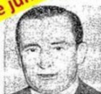
P. E. ARAMBURU UDELPA y D. PROGRESISTA