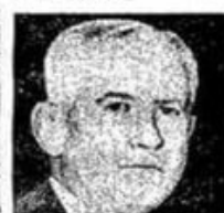
ALFREDO ORGAZ SOC. DEMOCRATICO

El análisis de los números absolutos de las recientes PASO 21, lleva a la certera conclusión que no se impuso Juntos por el Cambio, que vio reducido su caudal de votos en 1,7 millones respecto la elección anterior. Sino que hubo una notoria abstención por parte de quienes en la última elección votaron al Frente de Todos. Repitiéndose así el fenómeno que existía durante la proscripción del peronismo entre 1955 y 1973, en el cual el peronismo llamaba a no votar o votar en blanco, con la inusitada paradoja de que el actual gobierno se dice peronista.