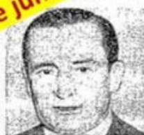
P. E. ARAMBURU UDELPA y D. PROGRESISTA