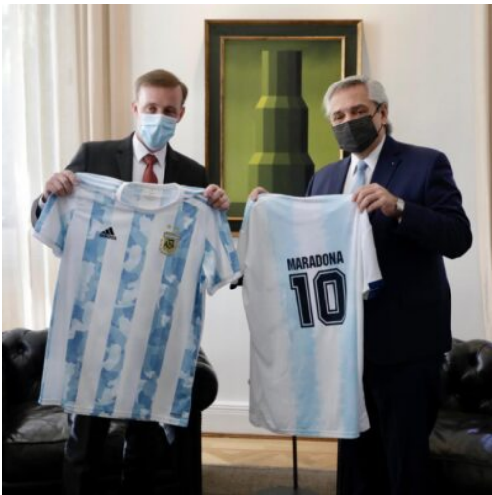
Jake Sullivan y presidente Alberto Fernández

parte de La Nación y Clarín. Hasta la visita el 6 de agosto a Buenos Aires, y entrevista personal con el presidente Fernández, del consejero de Seguridad Nacional del casi flamante presidente de EEUU James Biden, Jacob Jeremiah “Jake” Sullivan.