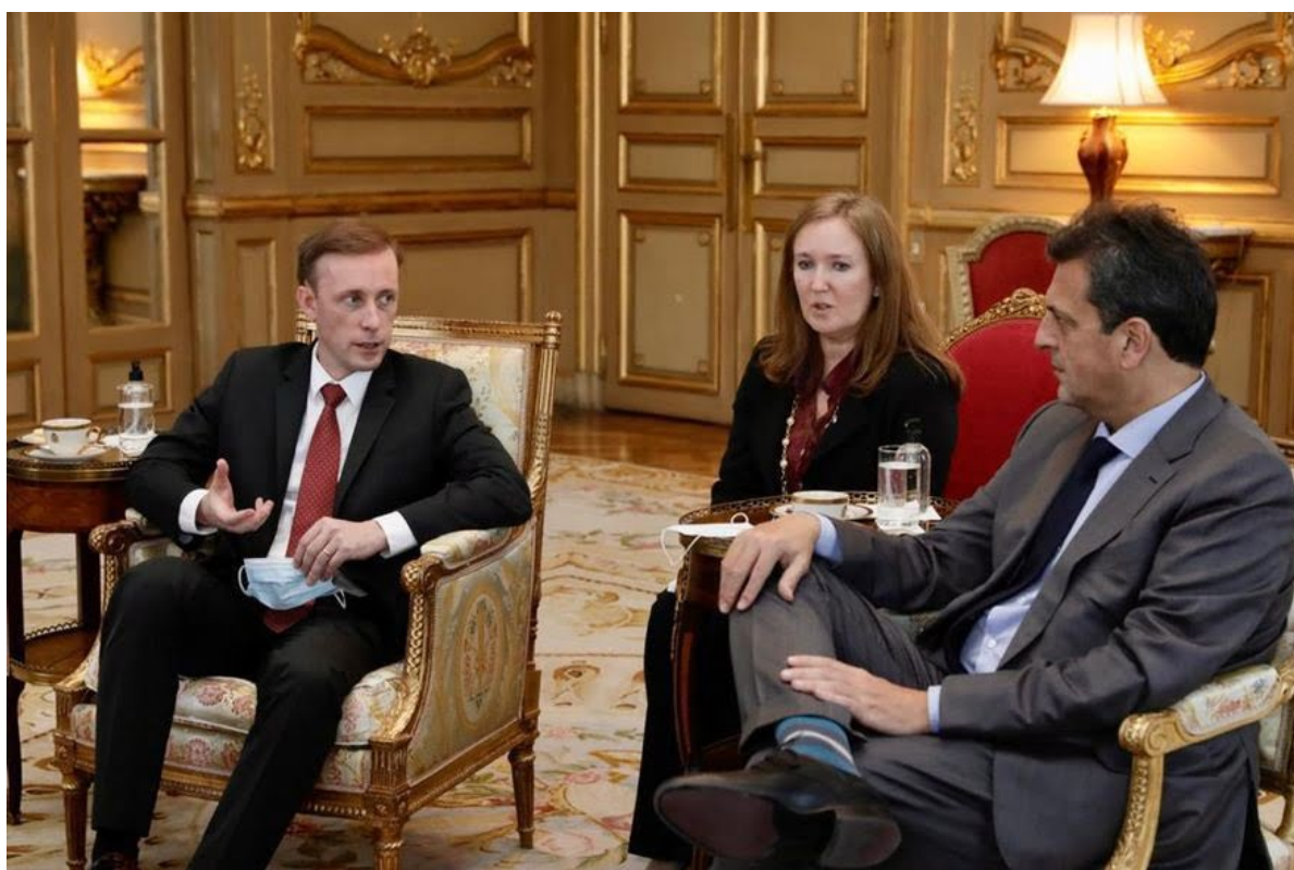
Jake Sullivan y Sergio Massa

Sumado a ello el hecho qué, desembozadamente y sin barbijos, también se entrevistó con el presidente de la Cámara de Diputados, Sergio Massa. Como si los conspicuos visitantes estuvieran tomando un examen a las máximas autoridades argentinas, para definir un rumbo certero a seguir.