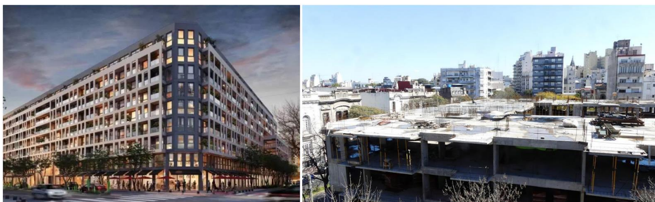
Astor San Telmo proyectado y su realidad de hoy