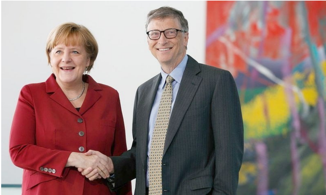
Premier Angela Merkel con Bill Gates