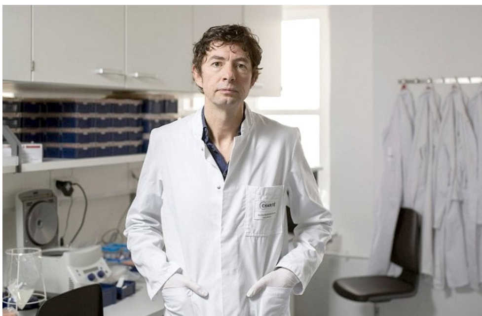
Dr. Christian Drosten

https://www.eurosurveillance.org/content/10.2807/1560-7917.ES.2020.25.3.2000045