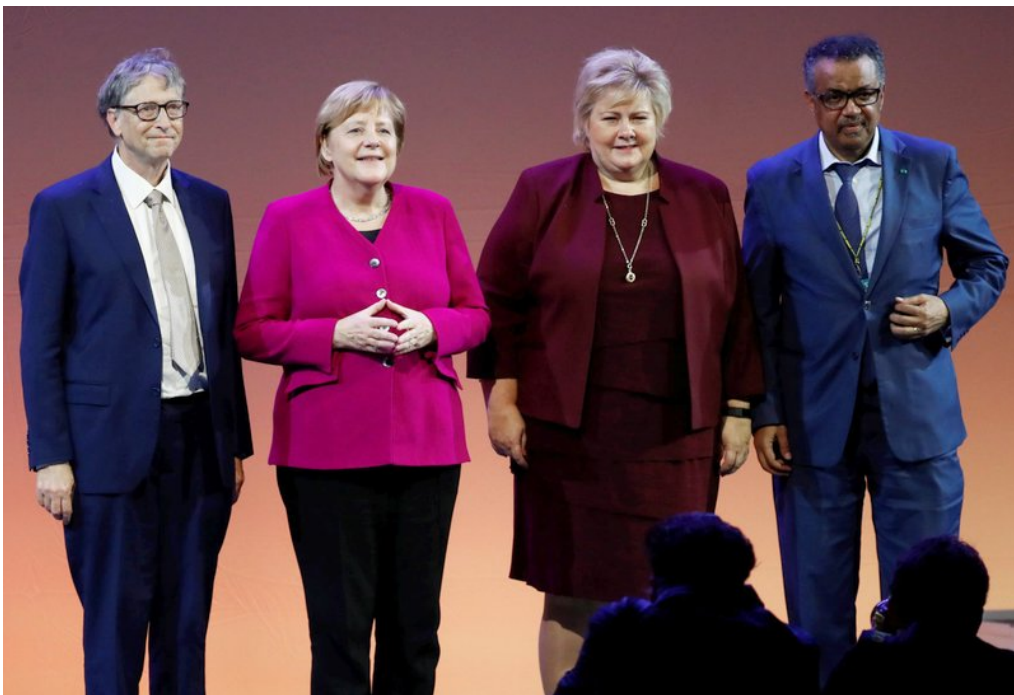
Billy Gates, premier de Alemania Angela Merkel, premier de Noruega Erna Solberg, y el director Gral de la OMS Tedros Adhanom Ghebreyesus

Si lo que estuviera en juego no fuera tan mortal para la humanidad, todo sería material para una comedia del absurdo. El zar mundial de la salud, el jefe de la OMS, Tedros, no es un médico, cuya OMS es financiada masivamente por un gerente informático multimillonario que abandonó la universidad, Gates, quien también asesora al gobierno de Merkel sobre las medidas COVID-19.