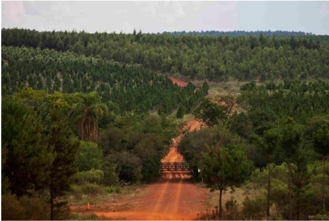
Foto de la empresa, donde expone las superficies forestadas.