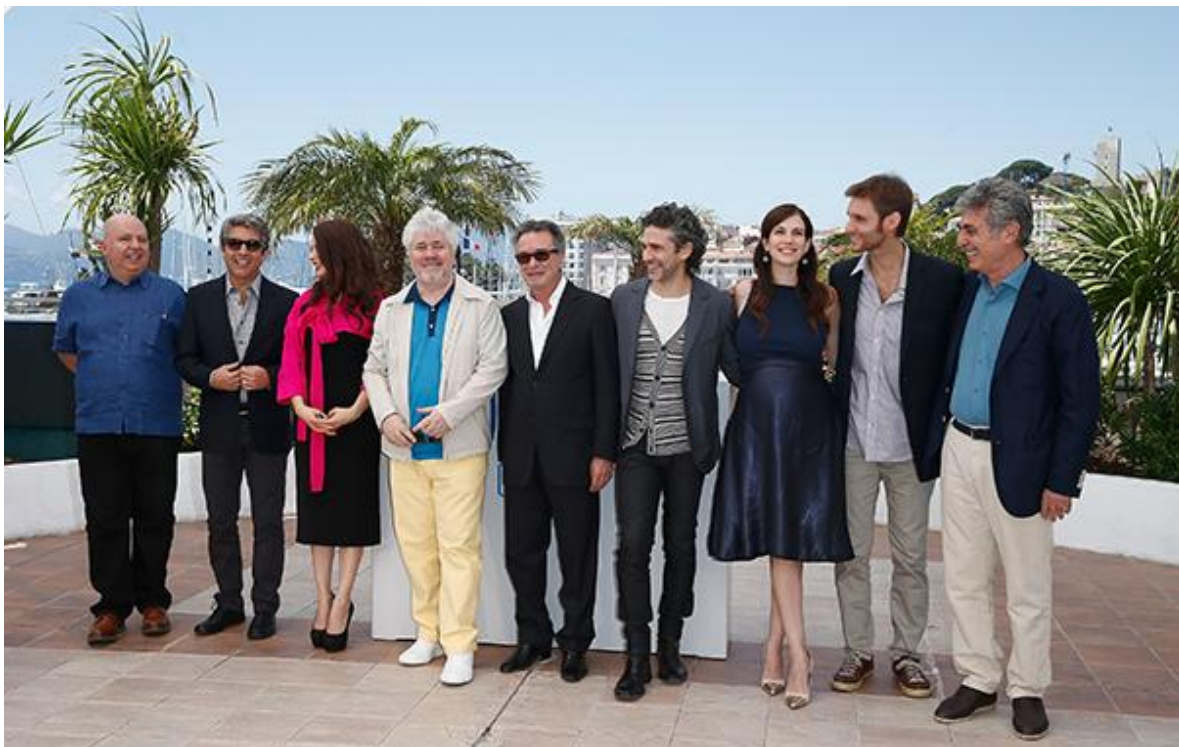
Sigman, a la derecha de la foto, junto con el elenco de Relatos Salvajes y Pedro Almodóvar, en Cannes.