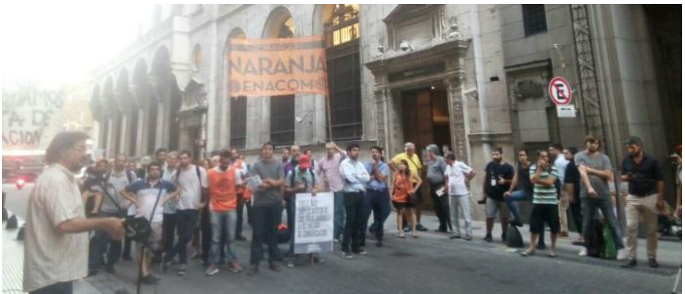
Foto de archivo de 2018, sobre un acto contra la fusión.

Por esa línea, nosotros impugnamos la fusión. Cuando lo hicimos, armamos un colectivo de distintas agrupaciones políticas, gremiales, estudiantiles, universitarias y de la cultura, que nos opusimos a la fusión. Incluso, con un proyecto de ley que presentó [la diputada nacional] Romina del Plá, que firmó Leopoldo Moreau, Fernanda Raverta, y Pino Solanas apoyó. Y fuimos intercambiando información; entre ellas, el tema de Greco y Bidart, que en este caso nos informamos por el medio de ustedes. Ahí, iniciamos una acción penal sobre este tema y al tener tanta difusión, la Oficina Anticorrupción lo tomó de oficio.