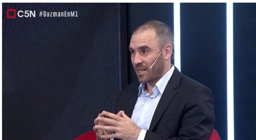
Ministro Guzmán en C5N

implicó un esfuerzo importantísimo. Las medidas de protección social van evolucionando. Hoy no es el momento de un IFE 4, así como no es el momento de otras cosas, porque hay que mantener ciertos equilibrios para también proteger a la actividad», aseguró Guzmán, suelto de cuerpo, en la entrevista de C5N, que tenía como primer destinatario al FMI.