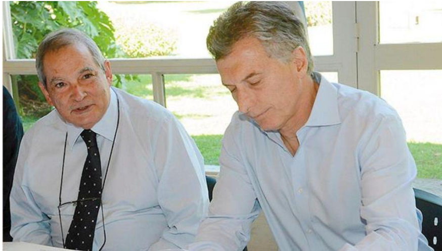
Jorge Lemus ministro de Salud y el ex presidente Mauricio Macri

Esta dolarización, el ministro Lemus la escondió en los artículos 4 y 5 del pliego. En el primero, titulado " Forma de Cotización ", estableció que, " no se aceptaban ofertas parciales " direccionando de entrada la licitación a favor de los grandes laboratorios. Y luego que " la cotización se realizará por el porcentaje de desvío, igual menor, respecto del precio de referencia del producto a suministrar ".