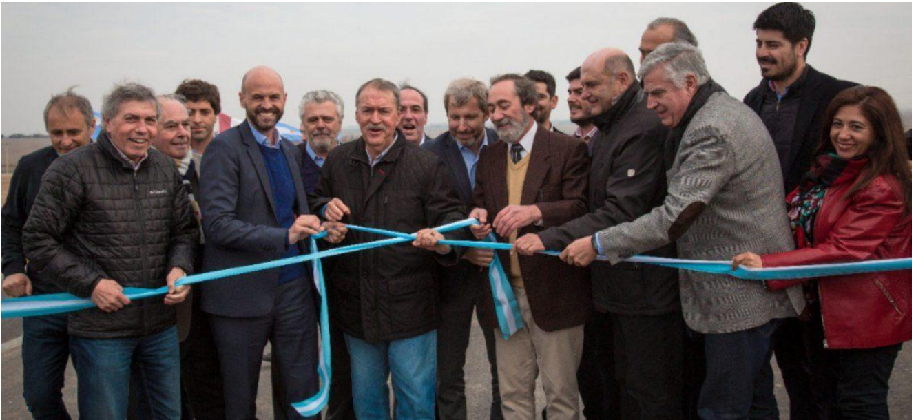
Foto de archivo de 2017, de la inauguración de la variante Elena, de la ruta 36.

la misma que recorrió De la Sota y lo llevó a su muerte. Dos años antes de terminar ese tramo, aportó para la campaña la importante suma de $150.000.