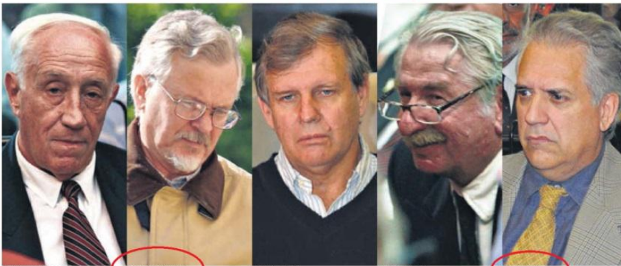
Jorge "Tigre" Acosta.