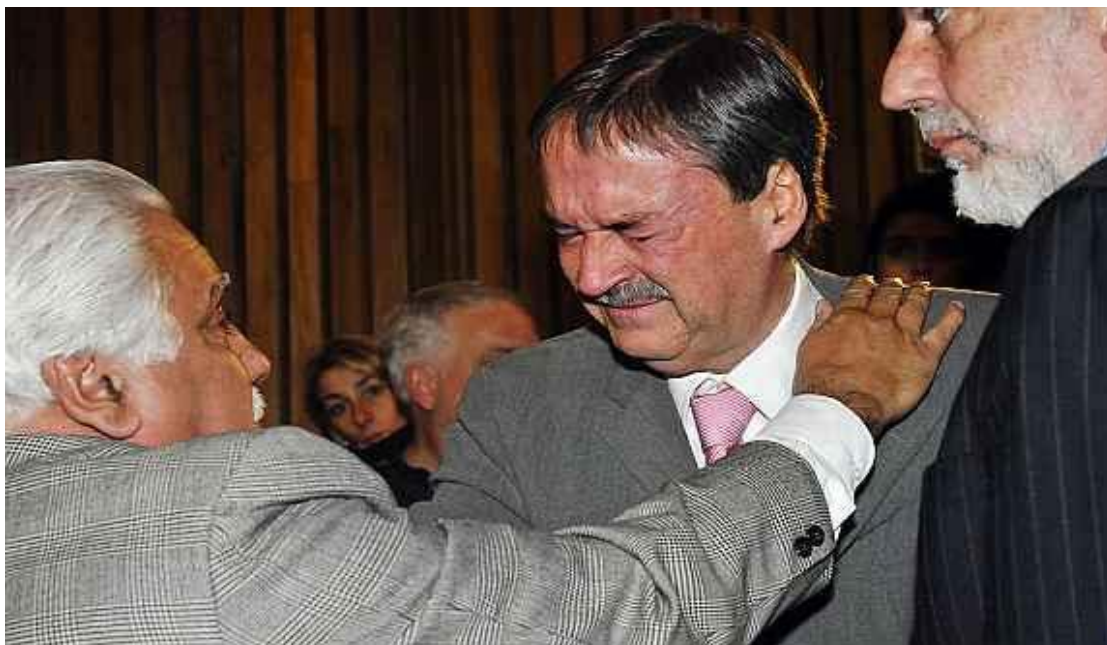
Schiaretti en el juicio de Menéndez julio 2008

“Hoy es un día histórico para Córdoba, porque la justicia de la democracia ha condenado al mayor responsable de la noche del terror en la cual estuvo sumida nuestra provincia hace 30 años. Él sembró muerte y terror, porque cometió crímenes de lesa humanidad y también impidió junto a sus secuaces cualquier pensamiento creativo en Córdoba, haciendo retroceder el reloj de la historia de nuestra provincia 70 años”.