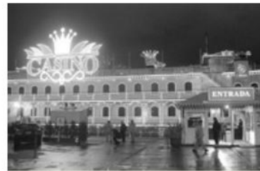
El Casino flotante es un barco que no puede navegar por todo lo que le construyeron encima.