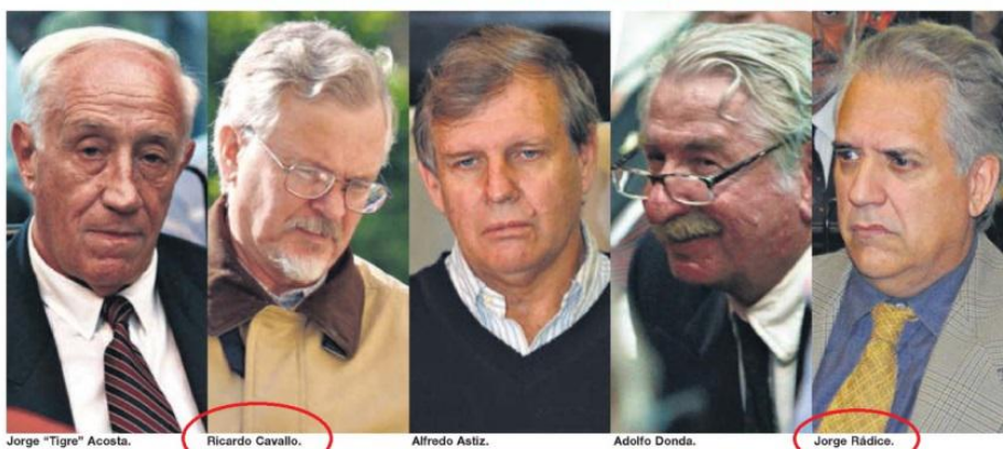
Jorge "Tigre" Acosta.