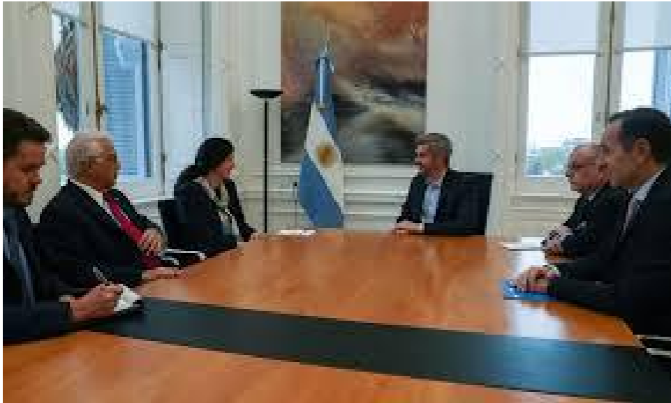
Kimberly Breier (izquierda) y Marcos Peña Centro

La dilatada visita de Kimberly Breier Argentina, fue anticipada por la Casa Blanca mediante un comunicado de prensa del Departamento de Estado de EE.UU, manifestando en él un profundo interés por Argentina. “Del 9 al 12 de mayo, la subsecretaria Breier viajará a Buenos Aires para profundizar la asociación entre Estados Unidos y Argentina en lo que respecta a la gobernabilidad democrática, el combate al terrorismo y el crimen transnacional, y la promoción del comercio libre, equitativo y recíproco.”