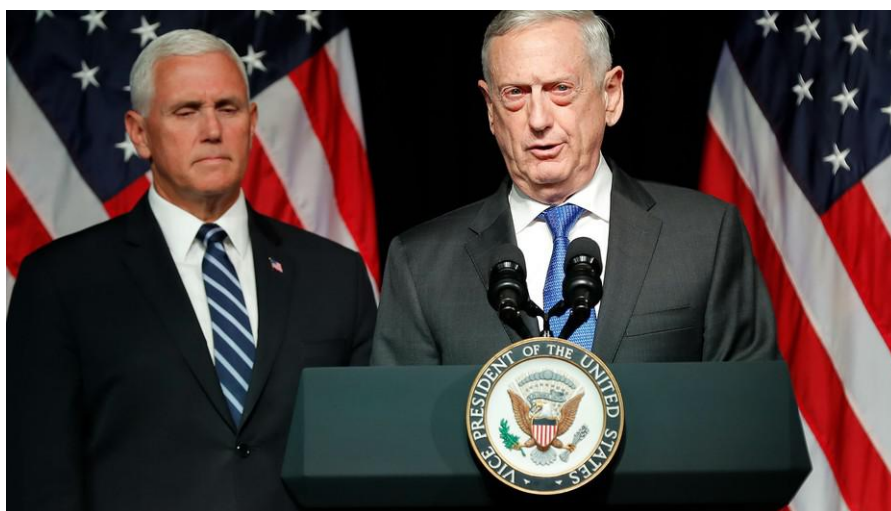
El secretario de Defensa de Estados Unidos, James Mattis (der)