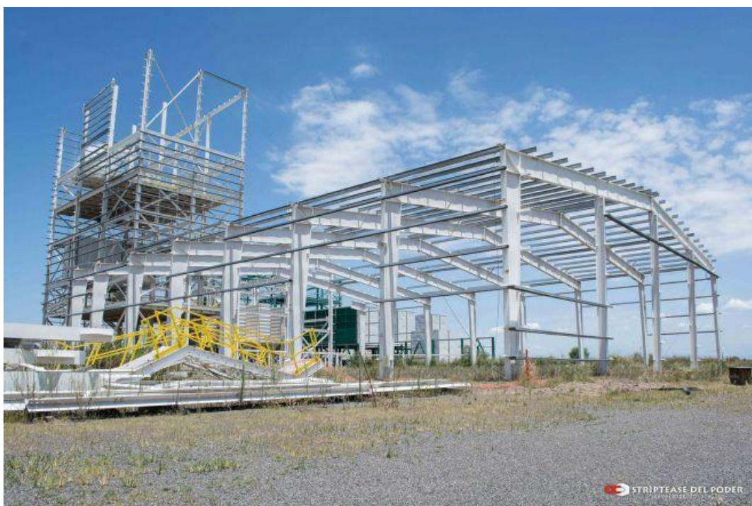
Fábrica de Monsanto en Malvinas Argentinas a medio terminar

Sin embargo, en el 2016, mientras los vecinos de Malvinas festejaban el triunfo contra la multinacional de las semillas transgénicas, paralelamente el rector Juri, que acaba de asumir, designó al frente de cargos importante de la UNC a una serie de personajes que hasta hacía horas habían trabajado