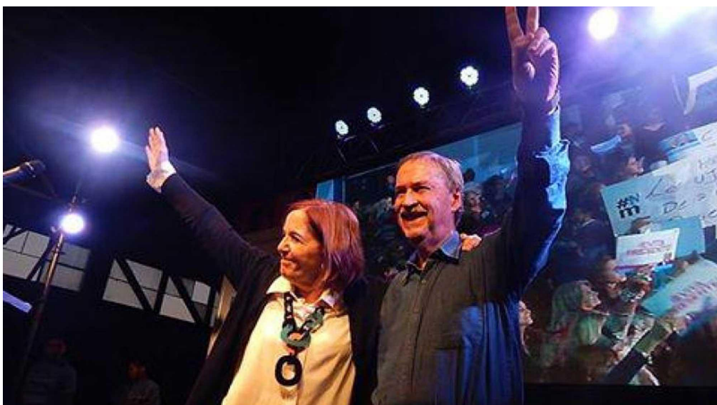
Diputada Alejandra Vigo y gobernador Juan Schiaretti

Antes del pase de bando de los dos votos de La Pampa, la cuenta habría quedado empatada en 127. Por eso a la par hubo otros movimientos. Uno fue de Alejandra Vigo, esposa del gobernador Schiaretti, quien mantiene una vieja amistad por cuestiones non sanctas con Macri. Diputada que tras un discurso que se pronunció en contra de la ley, tal como había anticipado públicamente, paso del no a la abstención. Con su voto negativo se hubiese impuesto el nó.