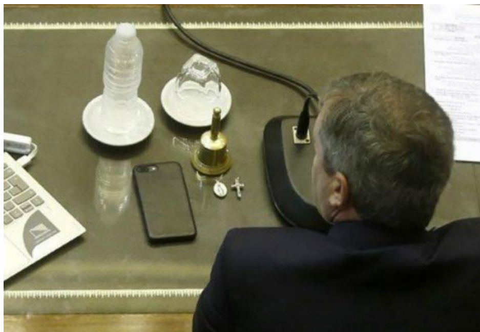
Presidente Cámara Diputados Emilio Monzó en el debate de la ley de aborto

Cambio de votos que resultaba indispensable para lograr su sanción con 129 votos a 125, porque en caso contrario el desempate en 127 quedaba en manos del presidente de la Cámara Emilio Monzó. Quién con un crucifijo y una medalla religiosa puestos sobre su escritorio, era vox pópulí que iba a votar en forma “no positiva”, rechazando la sanción.