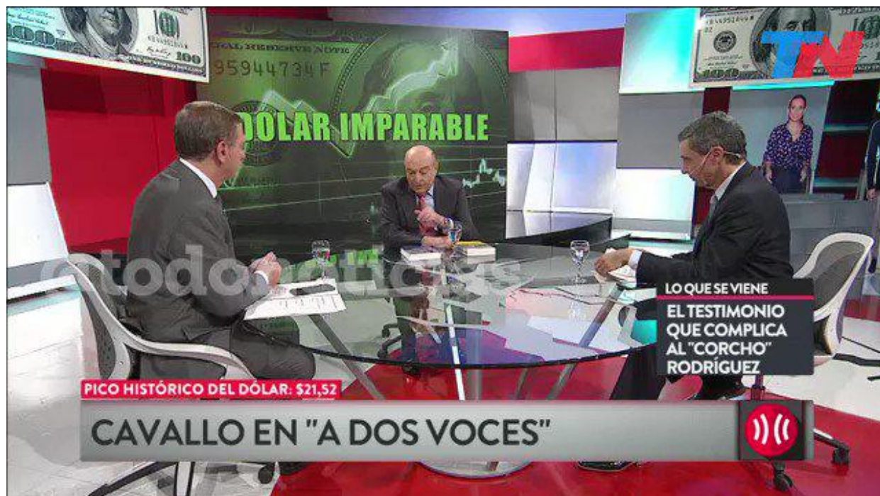
Cavallo en el programa “A Dos Voces” en canal TN del Grupo Clarín

los ministros Nicolás Dujovne (Hacienda) y Luis Caputo (Finanzas) para poner en su lugar a un íntimo amigo suyo: Federico Sturzenegger . Actual titular del Banco Central de la República Argentina (BCRA) que junto con Cavallo estuvo durante años procesado por el megamillonario hurto a las reservas de los bancos, llamado “Megacanje” y “corralito”.