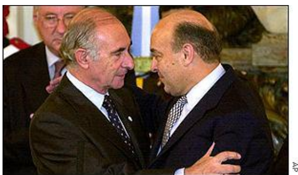
Cavallo y De la Rúa