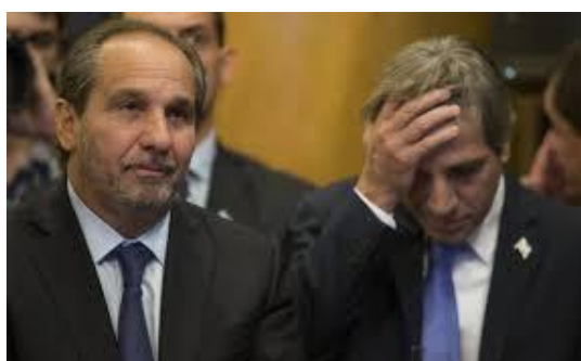
Nicky y Toto Caputo

Recientemente tuvo que exponer sobre la revelación de que omitió declarar la propiedad que detentaba sobre un entramado de compañías fantasmas en el exterior. administradas por Noctua Partners LLC. Las que a su vez son propietarias de otras offshore, que incluso aparecen como tenedoras de bonos argentinos colocados por el mismo ministro. Incubándose así la vehemente sospecha que esto podría ser un retorno por los altos servicios prestados a favor de los bancos acreedores internacionales.