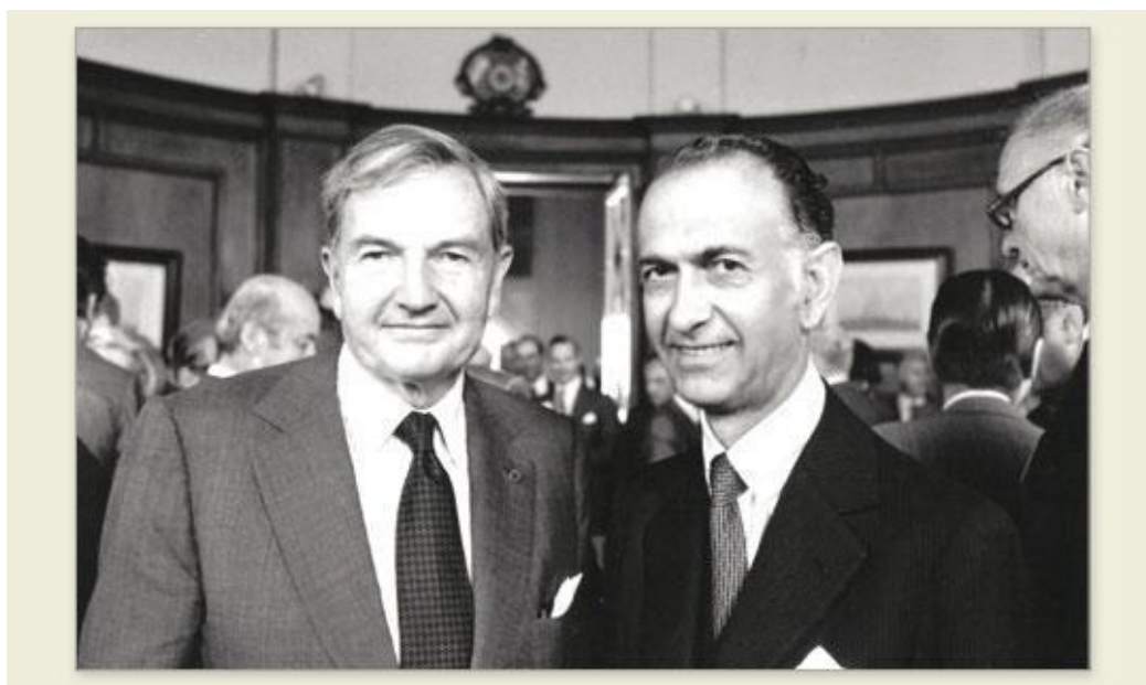
David Rockefeller y José Alfredo Martínez de Hoz