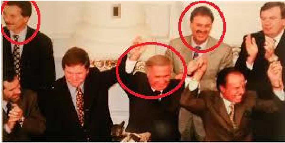
Asunción de De la Sota junto a Macri y Schiaretti en 1999

Ver Macri – De la Sota: Viejas relaciones, nuevos negocios