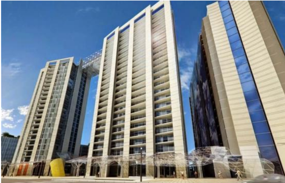
Esquema de lo que sería parte del Art María.