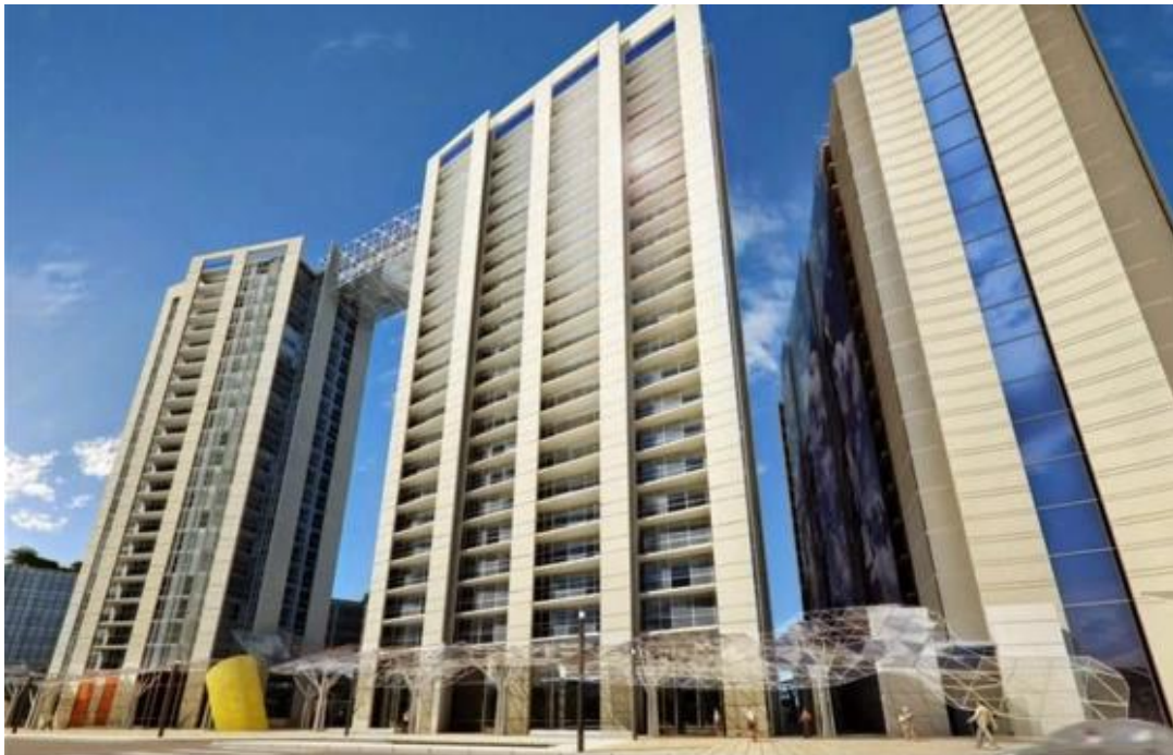
Esquema de lo que sería parte del Art María.