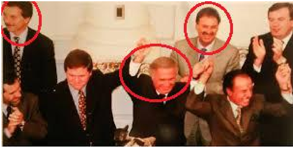
Asunción de De la Sota junto a Macri y Schiaretti en 1999

Ver Macri – De la Sota: Viejas relaciones, nuevos negocios